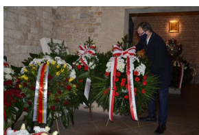
Kraków. Jedenasta rocznica katastrofy smoleńskiej.