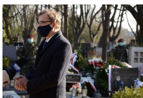
Kraków. Jedenasta rocznica katastrofy smoleńskiej.