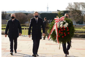
Kraków. Jedenasta rocznica katastrofy smoleńskiej.