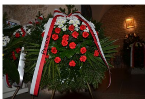
Kraków. Jedenasta rocznica katastrofy smoleńskiej.