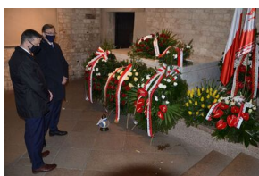
Kraków. Jedenasta rocznica katastrofy smoleńskiej.