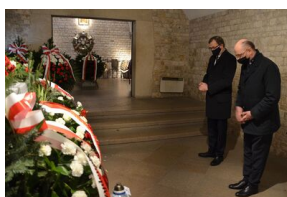
Kraków. Jedenasta rocznica katastrofy smoleńskiej.