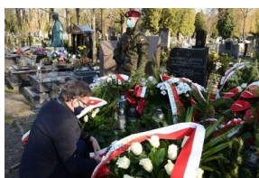
Kraków. Jedenasta rocznica katastrofy smoleńskiej.