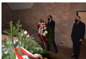
Kraków. Jedenasta rocznica katastrofy smoleńskiej.