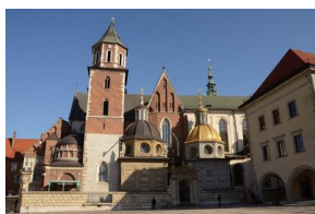
Kraków. Jedenasta rocznica katastrofy smoleńskiej.