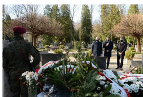
Kraków. Jedenasta rocznica katastrofy smoleńskiej.