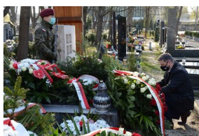
Kraków. Jedenasta rocznica katastrofy smoleńskiej.