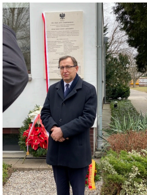
Uroczyste odsłonięcie tablicy upamiętniającej Jana i Antoninę Żabińskich - Sprawiedliwych wśród Narodów Świata - Warszawa, 24 marca 2021. Fot. Kamil Komorowski (OBUWiM IPN)

2021. Fot. Kamil Komorowski (OBUWiM IPN)