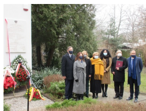
Uroczyste odsłonięcie tablicy upamiętniającej Jana i Antoninę Żabińskich - Sprawiedliwych wśród Narodów Świata - Warszawa, 24 marca 2021.