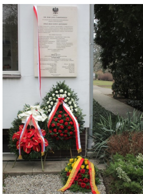
Uroczyste odsłonięcie tablicy upamiętniającej Jana i Antoninę Żabińskich - Sprawiedliwych wśród Narodów Świata - Warszawa, 24 marca 2021.