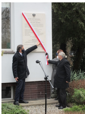
Uroczyste odsłonięcie tablicy upamiętniającej Jana i Antoninę Żabińskich - Sprawiedliwych wśród Narodów Świata - Warszawa, 24 marca 2021.