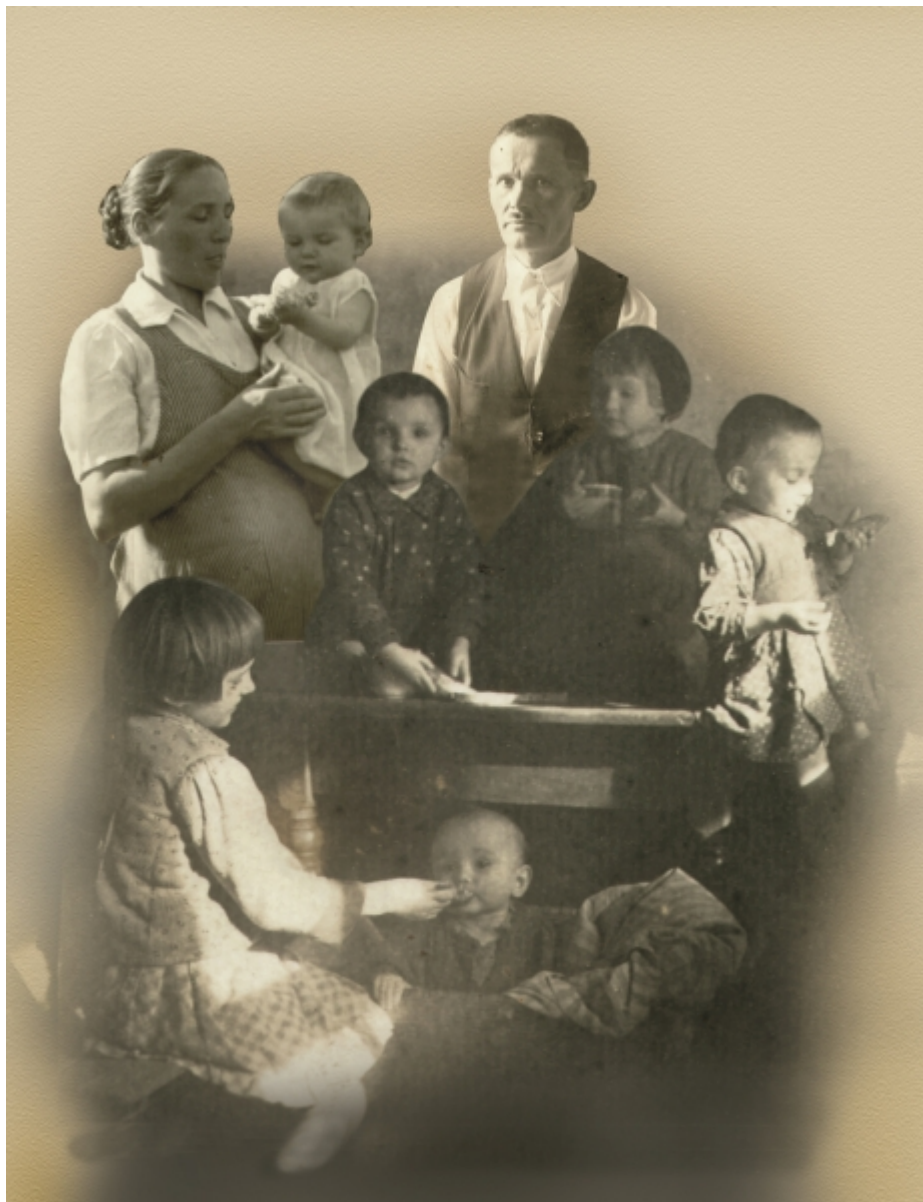
Rodzina Józefa i Wiktorii Ulmów z Markowej