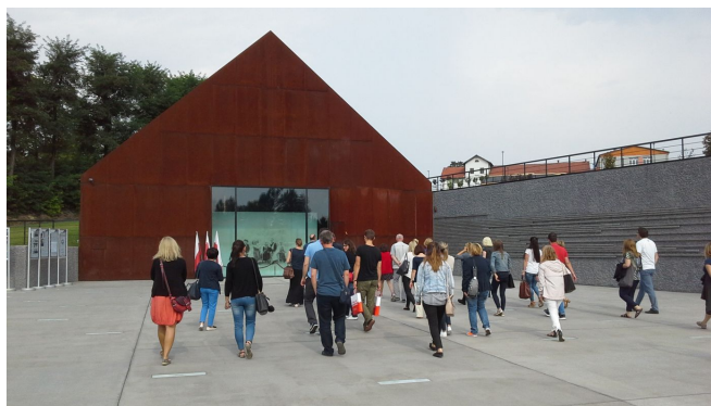
Muzeum Polaków Ratujących Żydów im. Rodziny Ulmów w Markowej