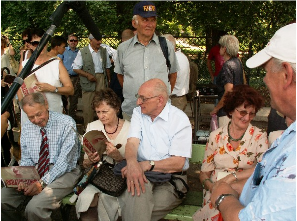
Na otwarcie wystawy przybył Władysław Bartoszewski