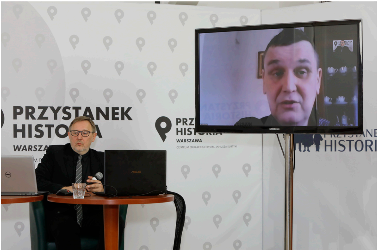
Dyskusja o stalinizacji życia w PRL na przykładzie Katowic - 12 marca 2021.