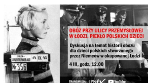
MINIATURA-Obóz przy ul. Przemysłowej w Łodzi- Piekło polskich dzieci

Pobierz aplikację multimedialną IPN i zobacz jak wyglądało to straszne miejsce oraz poznaj archiwalne zdjęcia i relacje więźniów.