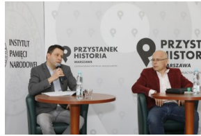
Liztmannstadt ©PŻycie ński_28