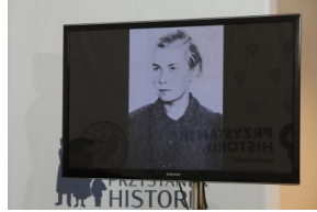
Liztmannstadt ©PŻycie ński_35