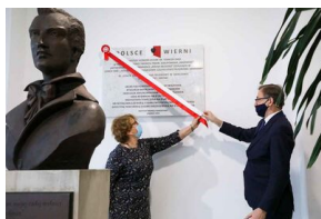
Odsłonięcie tablicy upamiętniającej antykomunistyczną organizację młodzieżową „Wolna Młodzież” w Pruszkowie - 1 marca 2021.