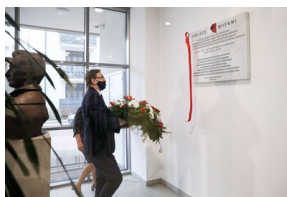
Odsłonięcie tablicy upamiętniającej antykomunistyczną organizację młodzieżową „Wolna Młodzież” w Pruszkowie - 1 marca 2021.