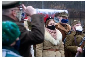
Obchody Narodowego Dnia Pamięci Żołnierzy Wyklętych na powązkowskiej „Łączce” - 1 marca 2021.