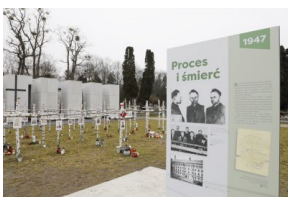
Wystawa IPN o rtm. Witoldzie Pileckim na „Łączce” - 1 marca 2021.