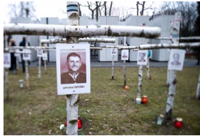
Obchody Narodowego Dnia Pamięci Żołnierzy Wyklętych na powązkowskiej „Łączce” - 1 marca 2021.