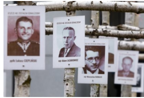
Obchody Narodowego Dnia Pamięci Żołnierzy Wyklętych na powązkowskiej „Łączce” - 1 marca 2021.