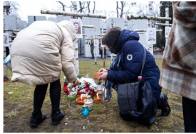
Obchody Narodowego Dnia Pamięci Żołnierzy Wyklętych na powązkowskiej „Łączce” - 1 marca 2021.