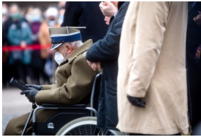
Płk Waldemar Nowakowski ps. Gacek podczas obchodów Narodowego Dnia Pamięci Żołnierzy Wyklętych na powązkowskiej „Łączce” - 1 marca 2021.