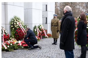
Obchody Narodowego Dnia Pamięci Żołnierzy Wyklętych na powązkowskiej „Łączce” - 1 marca 2021.