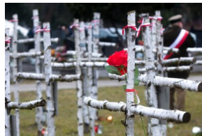
Obchody Narodowego Dnia Pamięci Żołnierzy Wyklętych na powązkowskiej „Łączce” - 1 marca 2021.