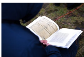
Obchody Narodowego Dnia Pamięci Żołnierzy Wyklętych na powązkowskiej „Łączce” - 1 marca 2021.

Kwatera „Ł” na Powązkach Wojskowych w Warszawie była miejscem potajmego zakopywania polskich bohaterów pomordowanych katyńskim strzałem w tył głowy przez funkcjonariuszy komunistycznych organów represji w latach 1948–1956. W Mauzoleum Żołnierzy Wyklętych, wybudowanym na tym miejscu, spoczywają dziś znalezione tu szczątki kilkudziesięciu Niezłomnych. Ich symbolicznymi przedstawicielami prezentowanymi na wystawach IPN są rtm. Witold Pilecki - „ochotnik do Auschwitz” oraz ppłk Łukasz Ciepliński, prezes IV Zarządu Głównego Zrzeszenia „Wolność i Niezawisłość”. Im właśnie poświęcone są wystawy, które zostały otwarte 1 marca br. w czasie centralnych uroczystości ku czci Żołnierzy Niezłomnych. Będą prezentowane do listopada 2021 r.