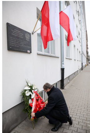
Prezes IPN dr Jarosław Szarek złożył kwiaty pod tablicą upamiętniającą ofiary reżimu komunistycznego w dawnej siedzibie NKWD/WUBP przy Strzeleckiej 8 w Warszawie - 1 marca 2021.