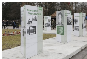
Wystawa IPN o rtm. Witoldzie Pileckim na „Łączce” - 1 marca 2021.