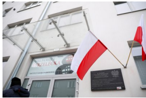
Prezes IPN dr Jarosław Szarek złożył kwiaty pod tablicą upamiętniającą ofiary reżimu komunistycznego w dawnej siedzibie NKWD/WUBP przy Strzeleckiej 8 w Warszawie - 1 marca 2021.

1 marca 2021 r. prezes IPN dr Jarosław Szarek złożył wieniec pod tablicą upamiętniającą ofiary reżimu komunistycznego, umieszczoną na budynku dawnej siedziby NKWD, a następnie b. Wojewódzkiego Urzędu Bezpieczeństwa Publicznego przy ul. Strzeleckiej 8 na Pradze w Warszawie.