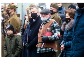
Obchody Narodowego Dnia Pamięci Żołnierzy Wyklętych na powązkowskiej „Łączce” - 1 marca 2021.