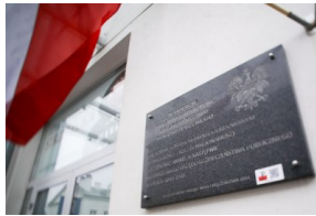
Prezes IPN dr Jarosław Szarek złożył kwiaty pod tablicą upamiętniającą ofiary reżimu komunistycznego w dawnej siedzibie NKWD/WUBP przy Strzeleckiej 8 w Warszawie - 1 marca 2021.