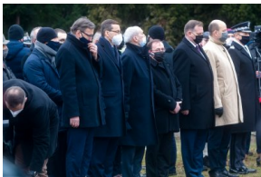
Obchody Narodowego Dnia Pamięci Żołnierzy Wyklętych na powązkowskiej „Łączce” - 1 marca 2021.