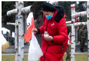
Obchody Narodowego Dnia Pamięci Żołnierzy Wyklętych na powązkowskiej „Łączce” - 1 marca 2021.