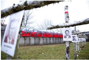
Obchody Narodowego Dnia Pamięci Żołnierzy Wyklętych na powązkowskiej „Łączce” - 1 marca 2021.