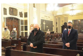
10.02.2021. Krakowskie uroczystości w 81. rocznicę pierwszej