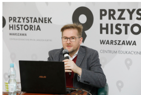
„Potomkowie Le Corbusiera i architekci, czyli marzenie o modernizacji miast” – wykład dr. hab. Piotra Majewskiego – 30 stycznia 2021.