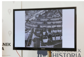
„Potomkowie Le Corbusiera i architekci, czyli marzenie o modernizacji miast” – wykład dr. hab. Piotra Majewskiego – 30 stycznia 2021.