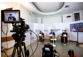
Dyskusja wokół książki „Leksykon bezpieczeństwa. Kadra kierownicza aparatu bezpieczeństwa 1944-1956. Tom I” – 19 stycznia 2021.