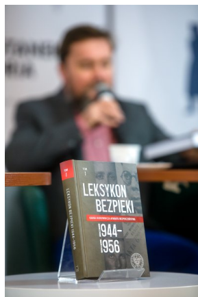
Dyskusja wokół książki „Leksykon bezpieczeństwa. Kadra kierownicza aparatu bezpieczeństwa