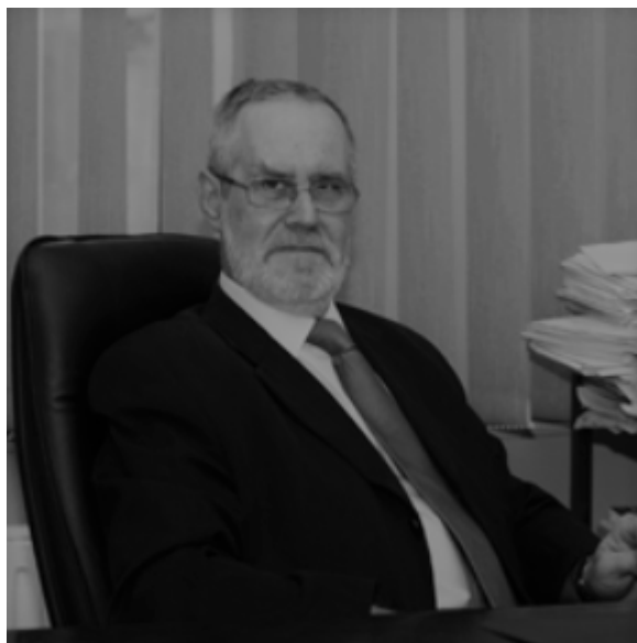
Śp. Janusz Margasiński.