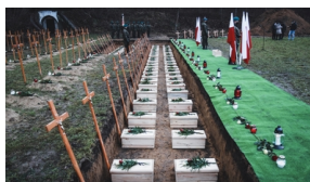
Trzecia ceremonia pogrzebowa ofiar niemieckich zbrodni – Pomiechówek, 17 grudnia 2020