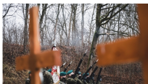
Trzecia ceremonia pogrzebowa ofiar niemieckich zbrodni – Pomiechówek, 17 grudnia 2020

Oddział reprezentacyjny Wojska Polskiego oddał salwę honorową. Zebrane delegacje złożyły wieńce i oddały hołd wszystkim pomordowanym. Uroczystość zakończyło odegranie przez wojskowego trębacza sygnału „Śpij kolego”.