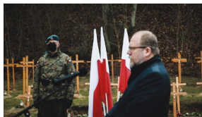
Trzecia ceremonia pogrzebowa ofiar niemieckich zbrodni - Pomiechówek, 17 grudnia 2020