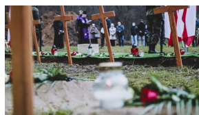
Trzecia ceremonia pogrzebowa ofiar niemieckich zbrodni - Pomiechówek, 17 grudnia 2020