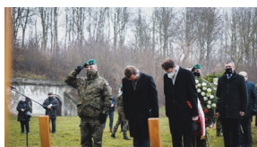
Trzecia ceremonia pogrzebowa ofiar niemieckich zbrodni – Pomiechówek, 17 grudnia 2020