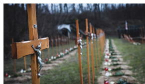
Trzecia ceremonia pogrzebowa ofiar niemieckich zbrodni – Pomiechówek, 17 grudnia 2020