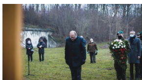
Trzecia ceremonia pogrzebowa ofiar niemieckich zbrodni – Pomiechówek, 17 grudnia 2020