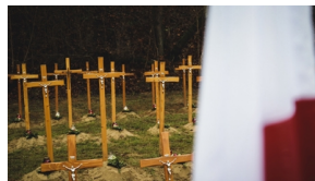
Trzecia ceremonia pogrzebowa ofiar niemieckich zbrodni - Pomiechówek, 17 grudnia 2020