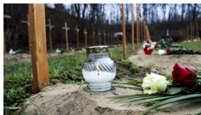
Trzecia ceremonia pogrzebowa ofiar niemieckich zbrodni - Pomiechówek, 17 grudnia 2020