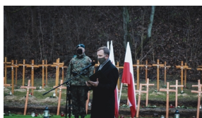
Trzecia ceremonia pogrzebowa ofiar niemieckich zbrodni - Pomiechówek, 17 grudnia 2020