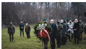
Trzecia ceremonia pogrzebowa ofiar niemieckich zbrodni – Pomiechówek, 17 grudnia 2020