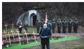
Trzecia ceremonia pogrzebowa ofiar niemieckich zbrodni - Pomiechówek, 17 grudnia 2020