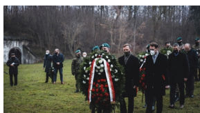
Trzecia ceremonia pogrzebowa ofiar niemieckich zbrodni – Pomiechówek, 17 grudnia 2020