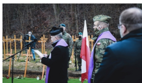
Trzecia ceremonia pogrzebowa ofiar niemieckich zbrodni - Pomiechówek, 17 grudnia 2020