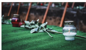
Trzecia ceremonia pogrzebowa ofiar niemieckich zbrodni – Pomiechówek, 17 grudnia 2020

W południe 17 grudnia 2020 r. na lewym dziedzińcu Fortu III w Pomiechówku, rozbrzmiały słowa pieśni „Kiedy ranne wstają zorze...”. Odśpiewali je wspólnie uczestnicy trzeciej już ceremonii pogrzebowej ofiar niemieckich zbrodni, których szczątki ekshumowano w ramach tegorocznego etapu prac na terenie fortu.