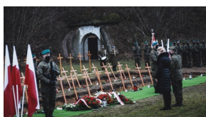
Trzecia ceremonia pogrzebowa ofiar niemieckich zbrodni – Pomiechówek, 17 grudnia 2020