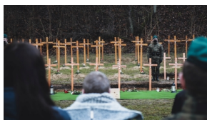
Trzecia ceremonia pogrzebowa ofiar niemieckich zbrodni - Pomiechówek, 17 grudnia 2020