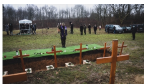
Trzecia ceremonia pogrzebowa ofiar niemieckich zbrodni - Pomiechówek, 17 grudnia 2020