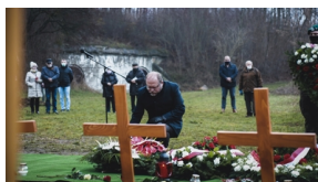
Trzecia ceremonia pogrzebowa ofiar niemieckich zbrodni – Pomiechówek, 17 grudnia 2020