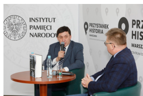
Dyskusja online „Czy zbliżenie polsko-sowieckie w obliczu wojny było możliwe?” - 8 grudnia 2020.