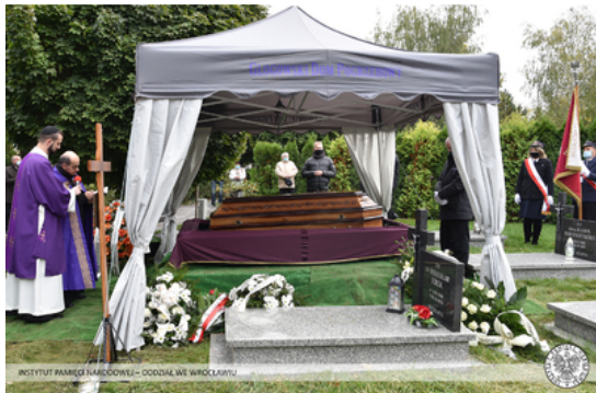
INSTYTUT PAMIĘCI NARODOWEJ – ODDZIAŁ WE WROCŁAWIU