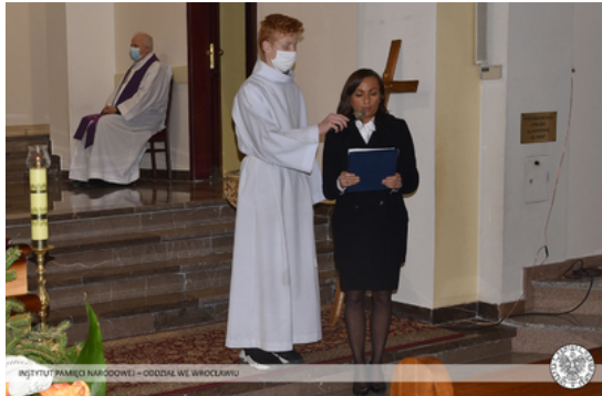
INSTYTUT PAMIĘCI NARODOWEJ – ODDZIAŁ WE WROCŁAWIU