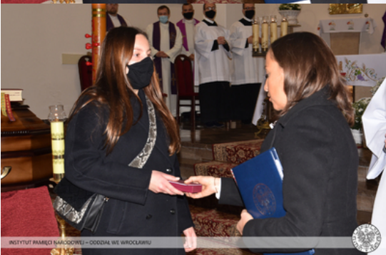
INSTYTUT PAMIĘCI NARODOWEJ – ODDZIAŁ WE WROCŁAWIU