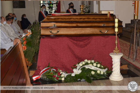
INSTYTUT PAMIĘCI NARODOWEJ – ODDZIAŁ WE WROCŁAWIU