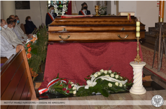
INSTYTUT PAMIĘCI NARODOWEJ – ODDZIAŁ WE WROCŁAWIU