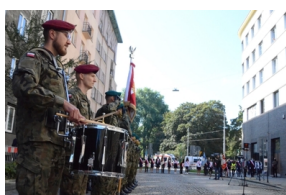
11.09.2020, uroczystości na ul. Pomorskiej w Krakowie.