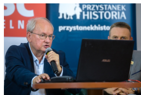
Konferencja prasowa w 40 rocznicę powstania Solidarności – Warszawa, 26 sierpnia 2020.