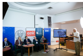
Konferencja prasowa w 40 rocznicę powstania Solidarności – Warszawa, 26 sierpnia 2020.

Na zakończenie zwrócił uwagę na liczne materiały i multimedia umieszczone na portalu oraz na nieznane wcześniej dokumenty sowieckie dotyczące „Solidarności”, pochodzące z KGB Sowieckiej Republiki Ukrainy. W kontekście publikacji raportu gen. S. Muchy warto podkreślić, że jest to pierwszy tej rangi dokument KGB, który mówi o reakcji społeczeństwa ukraińskiego na strajki w Polsce oraz prezentuje różnorodne działania operacyjne prowadzone w związku z tym przez KGB Ukrainy. Niezwykle ważne jest wskazanie w tym dokumencie daty 15 sierpnia 1980 r. jako momentu podjęcia przez kierownictwo KGB w Moskwie decyzji o realizacji przedsięwzięć na kierunku polskim. Oznacza to, że KGB szczegółowo i szybko dowiedziało się o sytuacji w Stoczni Gdańskiej i na Wybrzeżu. Potrafiło także skutecznie ocenić sytuację i zareagować szybciej, aniżeli polskie MSW.