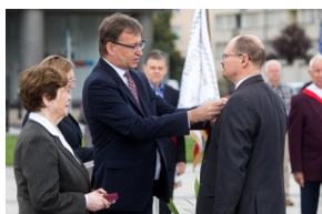
Wręczenie Krzyży Wolności i Solidarności zasłużonym działaczom opozycji antykomunistycznej z lat 1956-1989 - Warszawa, 28 sierpnia 2020.