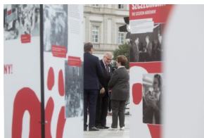
Wręczenie Krzyży Wolności i Solidarności zasłużonym działaczom opozycji antykomunistycznej z lat 1956-1989 - Warszawa, 28 sierpnia 2020.