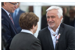
Wręczenie Krzyży Wolności i Solidarności zasłużonym działaczom opozycji antykomunistycznej z lat 1956-1989 - Warszawa, 28 sierpnia 2020.