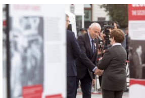
Wręczenie Krzyży Wolności i Solidarności zasłużonym działaczom opozycji antykomunistycznej z lat 1956-1989 - Warszawa, 28 sierpnia 2020.