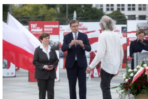
Wręczenie Krzyży Wolności i Solidarności zasłużonym działaczom opozycji antykomunistycznej z lat 1956-1989 - Warszawa, 28 sierpnia 2020.