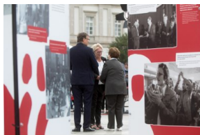
Wręczenie Krzyży Wolności i Solidarności zasłużonym działaczom opozycji antykomunistycznej z lat 1956-1989 - Warszawa, 28 sierpnia 2020.