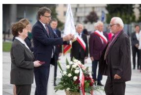
Wręczenie Krzyży Wolności i Solidarności zasłużonym działaczom opozycji antykomunistycznej z lat 1956-1989 - Warszawa, 28 sierpnia 2020.