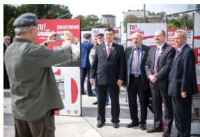
Wręczenie Krzyży Wolności i Solidarności zasłużonym działaczom opozycji antykomunistycznej z lat 1956-1989 - Warszawa, 28 sierpnia 2020.

Po uroczystym wręczeniu odznaczeń została zaprezentowana kompletna wersja wystawy plenerowej „Biało-czerwony szlak: TU rodziła się Solidarność”, przygotowana z okazji 40. rocznicy powstania NSZZ „Solidarność”, składająca się z modułów ogólnopolskich, regionalnych oraz kilkudziesięciu lokalnych, wcześniej prezentowanych przez oddziały IPN w 50 miastach Polski. Ekspozycję będzie można oglądać do 16 października 2020 r.