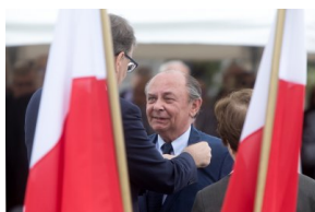
Wręczenie Krzyży Wolności i Solidarności zasłużonym działaczom opozycji antykomunistycznej z lat 1956-1989 - Warszawa, 28 sierpnia 2020.