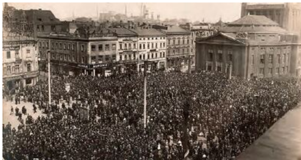
Manifestacja na rynku w Katowicach.

Wiosną 1920 r. kampania plebiscytowa na Górnym Śląsku nabrała tempa. Przełożyło się to na liczne, żywiołowe wystąpienia zarówno po stronie polskiej, jak i niemieckiej. Niemcy stworzyli liczne bojówki wspierane przez niemiecką policję bezpieczeństwa ( Sicherheitspolizei , w skrócie: Sipo), które terroryzowały ludność, rozbijały polskie zebrania i atakowały siedziby polskich organizacji. 25 kwietnia miał miejsce w