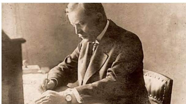
Wojciech Korfanty - polski komisarz plebiscytowy.