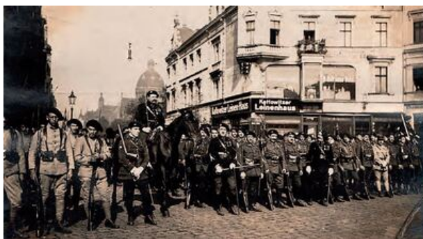
Francuzi na Rynku w Katowicach w 1920 r.