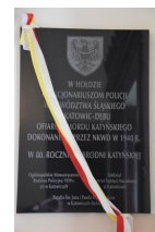
21 czerwca 2020 r. została odsłonięta tablica upamiętniająca śląskich policjantów II Rzeczypospolitej Polskiej z Katowic-Dębu, ofiary Zbrodni Katyńskiej.