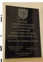
Tablica upamiętniająca śląskich policjantów II Rzeczypospolitej Polskiej z Katowic-Dębu, ofiary Zbrodni Katyńskiej.

„Policyjny znak pamięci” jest inicjatywą Zarządu Ogólnopolskiego Stowarzyszenia Rodzina Policyjna 1939 r. w Katowicach, którą wsparły parafia w Katowicach-Dębie oraz Oddział IPN w Katowicach. Tablica została umieszczona wewnątrz kościoła – w przedsionku (kruchcie).