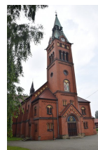
W kościele pw. św. Jana i Pawła Męczenników w Katowicach zostanie odsłonięta tablica upamiętniająca śląskich policjantów II Rzeczypospolitej Polskiej z Katowic-Dębu, ofiary Zbrodni Katyńskiej.