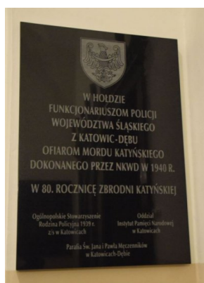
Tablica pamiątkowa odsłonięta w holidzie śląskim policjantom z Katowic-Dębu.

21 czerwca 2020w kościele pw. św. Jana i Pawła Męczenników w Katowicach, przy ul. Chorzowskiej 160, została odsłonięta tablica upamiętniająca śląskich policjantów II Rzeczypospolitej Polskiej z Katowic-Dębu, ofiary Zbrodni Katyńskiej