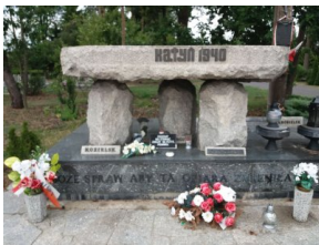
Pomnik Ofiar Katyńskich przed remontem