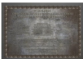
Tablica na fasadzie kościoła w Skomielnej Białej