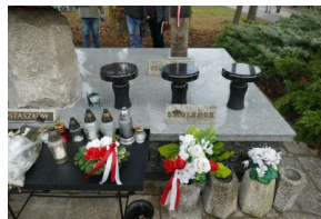
Pomnik Ofiar Katyńskich po remoncie