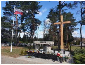
Pomnik Ofiar Katyńskich po remoncie