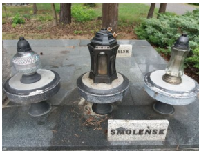
Pomnik Ofiar Katyńskich przed remontem