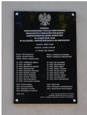
Tablica upamiętniająca poległych funkcjonariuszy Policji Państwowej Ziemi Mieleckiej