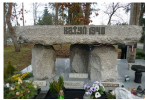
Pomnik Ofiar Katyńskich po remoncie