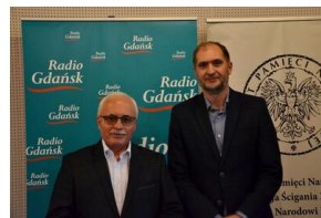
Projekt notacyjny „Wielka Solidarność”.