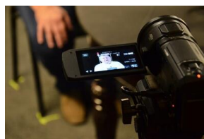
Projekt notacyjny „Wielka Solidarność”.