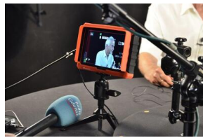
Projekt notacyjny „Wielka Solidarność”.