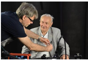
Projekt notacyjny „Wielka Solidarność”.