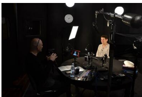
Projekt notacyjny „Wielka Solidarność”.

Efektom końcowym projektu „Wielka Solidarność” będzie co najmniej 50 notacji, na bazie których Radio Gdańsk przygotuje okolicznościowe audycje historyczne. Zostaną one wyemitowane w lipcu i sierpniu br., ponadto ukaże się również płyta DVD pt. „#Pamięć. Sierpień 1980”, zawierająca niektóre z nagrań. Notacje zostaną również wykorzystane przez Instytut Pamięci Narodowej do celów edukacyjnych, naukowych i popularyzatorskich.