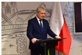
Wojewoda opolski Sławomir Kłosowski.