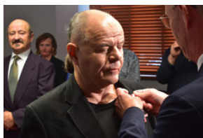
Uroczystość wręczenia Krzyży Wolności i Solidarności – Opole, 16 listopada 2023.