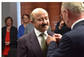
Uroczystość wręczenia Krzyży Wolności i Solidarności – Opole, 16 listopada 2023.