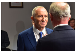
Uroczystość wręczenia Krzyży Wolności i Solidarności - Opole, 16 listopada 2023.