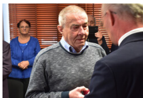
Uroczystość wręczenia Krzyży Wolności i Solidarności – Opole, 16 listopada 2023.