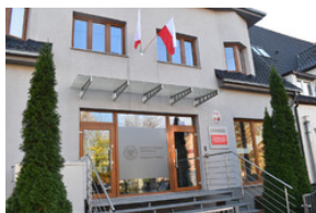
Nowa siedziba Delegatury IPN w Opolu przy ul. Augustyna Košnego 62.