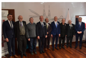
Uroczystość wręczenia Krzyży Wolności i Solidarności – Opole, 16 listopada 2023.