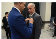
Kielce. Wręczenie Krzyży Wolności i Solidarności.