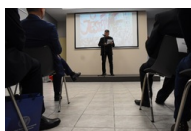
Kielce. Wręczenie Krzyży Wolności i Solidarności.