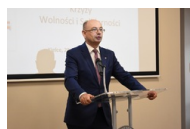
Kielce. Wręczenie Krzyży Wolności i Solidarności.