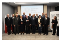
Kielce. Wręczenie Krzyży Wolności i Solidarności.