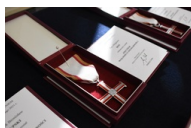
Kielce. Wręczenie Krzyży Wolności i Solidarności.

Podczas ceremonii odznaczonych zostało 14 działaczy opozycji antykomunistycznej z byłego województwa kieleckiego.