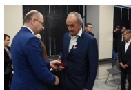
Kielce. Wręczenie Krzyży Wolności i Solidarności.