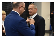
Kielce. Wręczenie Krzyży Wolności i Solidarności.