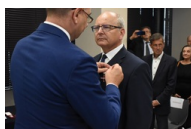
Kielce. Wręczenie Krzyży Wolności i Solidarności.