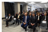
Kielce. Wręczenie Krzyży Wolności i Solidarności.