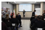
Kielce. Wręczenie Krzyży Wolności i Solidarności.