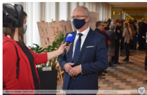
Wręczenie Krzyża Wolności i Solidarności działaczom opozycji – Opole, 14 stycznia 2022