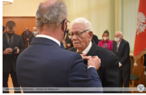
Wręczenie Krzyża Wolności i Solidarności działaczom opozycji – Opole, 14 stycznia 2022