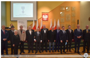
Wręczenie Krzyża Wolności i Solidarności działaczom opozycji – Opole, 14 stycznia 2022