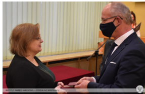
Wręczenie Krzyża Wolności i Solidarności działaczom opozycji – Opole, 14 stycznia 2022