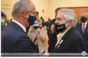
Wręczenie Krzyża Wolności i Solidarności działaczom opozycji – Opole, 14 stycznia 2022