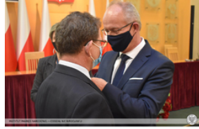
Wręczenie Krzyża Wolności i Solidarności działaczom opozycji – Opole, 14 stycznia 2022