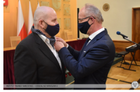
Wręczenie Krzyża Wolności i Solidarności działaczom opozycji – Opole, 14 stycznia 2022