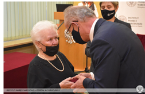
Wręczenie Krzyża Wolności i Solidarności działaczom opozycji – Opole, 14 stycznia 2022