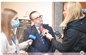
Wręczenie Krzyża Wolności i Solidarności działaczom opozycji – Opole, 14 stycznia 2022