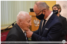
Wręczenie Krzyża Wolności i Solidarności działaczom opozycji – Opole, 14 stycznia 2022