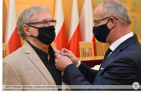
Wręczenie Krzyża Wolności i Solidarności działaczom opozycji – Opole, 14 stycznia 2022