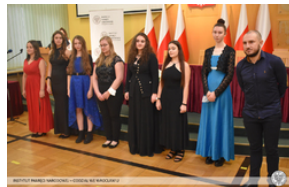
Wręczenie Krzyża Wolności i Solidarności działaczom opozycji – Opole, 14 stycznia 2022