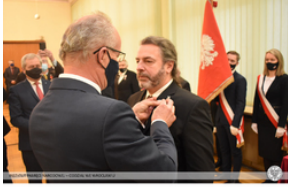
Wręczenie Krzyża Wolności i Solidarności działaczom opozycji – Opole, 14 stycznia 2022