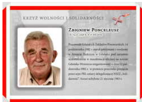
Oznaczeni Krzyżem Wolności i Solidarności - Gdańsk, 17 grudnia 2021