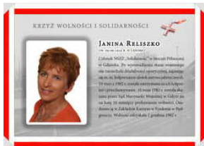
Oznaczeni Krzyżem Wolności i Solidarności - Gdańsk, 17 grudnia 2021