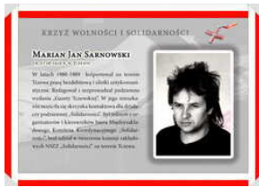
Oznaczeni Krzyżem Wolności i Solidarności - Gdańsk, 17 grudnia 2021