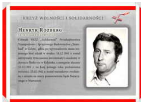
Oznaczeni Krzyżem Wolności i Solidarności - Gdańsk, 17 grudnia 2021