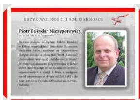
Odznaczeni Krzyżem Wolności i Solidarności – Gdańsk, 17 grudnia 2021