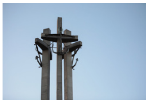
Prezes IPN dr Karol Nawrocki oddał hołd ofiarom masakry na Wybrzeżu.