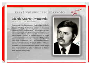
Odznaczeni Krzyżem Wolności i Solidarności – Gdańsk, 17 grudnia 2021