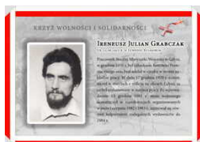
Odznaczeni Krzyżem Wolności i Solidarności – Gdańsk, 17 grudnia 2021

(publikujemy listę i biogramy jedynie tych osób, które wyraziły zgodę na przetwarzanie danych osobowych)