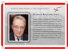
Oznaczeni Krzyżem Wolności i Solidarności - Gdańsk, 17 grudnia 2021