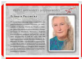
Oznaczeni Krzyżem Wolności i Solidarności - Gdańsk, 17 grudnia 2021