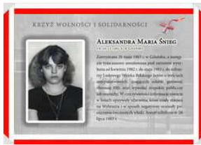
Oznaczeni Krzyżem Wolności i Solidarności - Gdańsk, 17 grudnia 2021