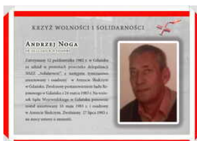
Odznaczeni Krzyżem Wolności i Solidarności – Gdańsk, 17 grudnia 2021