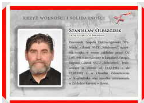
Oznaczeni Krzyżem Wolności i Solidarności - Gdańsk, 17 grudnia 2021