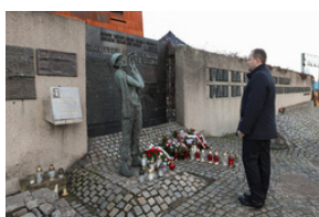
Prezes IPN dr Karol Nawrocki oddał hołd ofiarom masakry na Wybrzeżu.