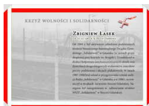
Odznaczeni Krzyżem Wolności i Solidarności – Gdańsk, 17 grudnia 2021