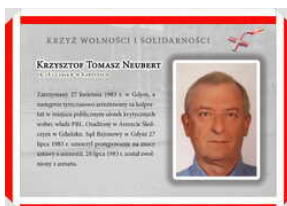
Odznaczeni Krzyżem Wolności i Solidarności – Gdańsk, 17 grudnia 2021