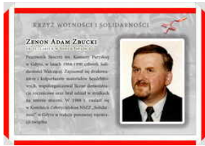
Oznaczeni Krzyżem Wolności i Solidarności - Gdańsk, 17 grudnia 2021

Krzyż Wolności i Solidarności został ustanowiony przez Sejm 5 sierpnia 2010 roku. Po raz pierwszy przyznano go w czerwcu 2011 roku przy okazji obchodów 35. rocznicy protestów społecznych w Radomiu. Krzyż nadawany jest przez Prezydenta RP, na wniosek Prezesa Instytutu Pamięi Narodowej, działaczom opozycji wobec dyktatury komunistycznej, za działalność na rzecz odzyskania przez Polskę niepodległości i suwerenności lub respektowanie praw człowieka w PRL. Źródłem uchwalenia Krzyża Wolności i Solidarności jest Krzyż Niepodległości z II Rzeczypospolitej.