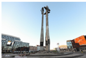
Prezes IPN dr Karol Nawrocki oddał hołd ofiarom masakry na Wybrzeżu.