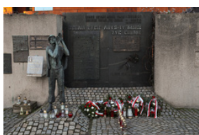
Prezes IPN dr Karol Nawrocki oddał hołd ofiarom masakry na Wybrzeżu.