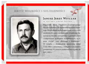
Oznaczeni Krzyżem Wolności i Solidarności - Gdańsk, 17 grudnia 2021