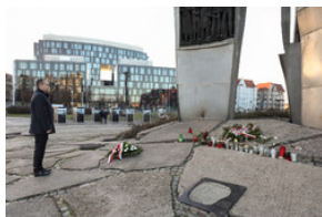
Prezes IPN dr Karol Nawrocki oddał hołd ofiarom masakry na Wybrzeżu.

W czasie swojego pobytu w Gdańsku prezes IPN złożył także kwiaty pod pomnikiem Poległych Stoczniovców 1970, oddając hołd ofiarom pamiętnego grudnia.