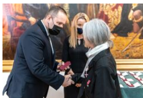
Uroczystość wręczenia Krzyży Wolności i Solidarności – Lublin, 14 grudnia 2021.

– Bohaterowie wolności. Bohaterowie mojego pokolenia. Za tę wolność chciałem wam podziękować. Nie tylko jako prezes IPN, ale także jako przedstawiciel pokolenia depozytariuszy tej wolności, którą nam przynieśliście – zwrócił się na samym początku do odznaczonych prezes Instytutu Pamięci Narodowej, dr Karol Nawrocki.