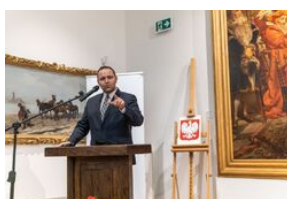
Uroczystość wręczenia Krzyży Wolności i Solidarności – Lublin, 14 grudnia 2021.