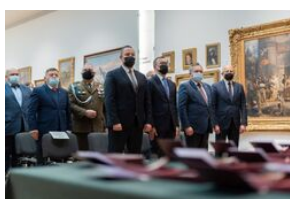
Uroczystość wręczenia Krzyży Wolności i Solidarności – Lublin, 14 grudnia 2021.