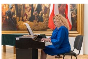
Uroczystość wręczenia Krzyży Wolności i Solidarności – Lublin, 14 grudnia 2021.

- To państwo jesteście tym pokoleniem Polaków, których bieg w sztafecie pokoleń Polaków kończy się niepodległością. (...) W waszych biogramach i życiorysach widzimy ogromne pragnienie wolności, którą spotykało się z równą wobec was wszystkich nienawiścią systemu komunistycznego. Systemu, który was inwigilował, skazywał, internował i więził w komunistycznych więzieniach. Z waszego pragnienia narodziło się zwycięstwo, wolność, i wolna niepodległa Polska – zakończył szef IPN, dr Nawrocki.