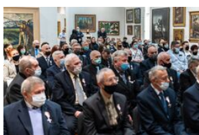
Uroczystość wręczenia Krzyży Wolności i Solidarności – Lublin, 14 grudnia 2021.