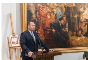
Uroczystość wręczenia Krzyży Wolności i Solidarności – Lublin, 14 grudnia 2021.