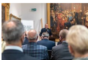
Uroczystość wręczenia Krzyży Wolności i Solidarności – Lublin, 14 grudnia 2021.

Prezes IPN zwrócił również uwagę na to, że woła walki o wolność bohaterów uroczystości pokonała totalitarny reżim komunistyczny