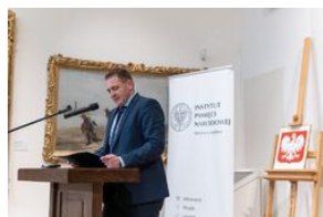
Uroczystość wręczenia Krzyży Wolności i Solidarności – Lublin, 14 grudnia 2021.

Uroczystość wręczenia odznaczeń państwowych działaczom opozycji niepodległościowej z lat 1956–1989 odbyła się w Muzeum Narodowym w Lublinie (Zamek Lubelski) w Galerii Malarstwa Polskiego XIX-XX wieku 14 grudnia 2021, Wzięli w niej udział przedstawiciele władz państwowych, samorządowych, wojska i służb mundurowych oraz stowarzyszeń represjonowanych.