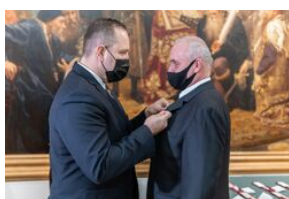
Uroczystość wręczenia Krzyży Wolności i Solidarności – Lublin, 14 grudnia 2021.