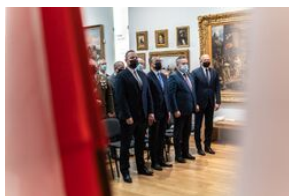
Uroczystość wręczenia Krzyży Wolności i Solidarności – Lublin, 14 grudnia 2021.