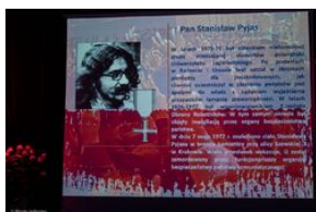
Uroczystość wręczenia Krzyży Wolności i Solidarności – Warszawa, 3 czerwca 2019.