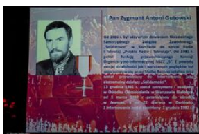
Uroczystość wręczenia Krzyży Wolności i Solidarności – Warszawa, 3 czerwca 2019.