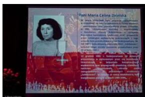
Uroczystość wręczenia Krzyży Wolności i Solidarności – Warszawa, 3 czerwca 2019.