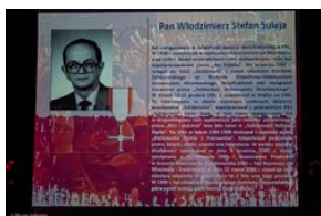
Uroczystość wręczenia Krzyży Wolności i Solidarności – Warszawa, 3 czerwca 2019.