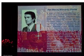
Uroczystość wręczenia Krzyży Wolności i Solidarności – Warszawa, 3 czerwca 2019.