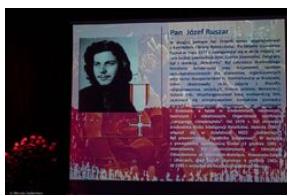
Uroczystość wręczenia Krzyży Wolności i Solidarności – Warszawa, 3 czerwca 2019.