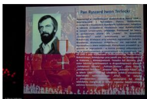
Uroczystość wręczenia Krzyży Wolności i Solidarności – Warszawa, 3 czerwca 2019.