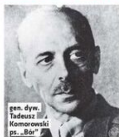
gen. dyw. Tadeusz Komorowski ps. „Bór”

G dyby ktoś mnie pytał o ważne daty z okresu 1939–1945, to uważam, że 14 lutego 1942 r. jest jedną z nich. Tego dnia Naczelný Wódz, gen. Władysław Sikorski, przekształcił Związek Walki Zbrojnej w Armię Krajową i mianował jej dowódcą gen. Stefana Roweckiego.