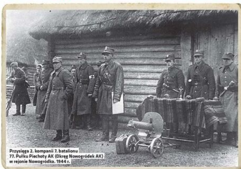
Przysięga 2. kompanii 7. batalionu 77. Pułku Piechoty AK (Okręg Nowogródka AK) w rejonie Nowogródka, 1944 r.

Żołnierze AK przygotowywali również powstanie powszechne w ramach akcji „Burza”, które miało pokazać nadciągającej Armii Czerwonej, że Polacy