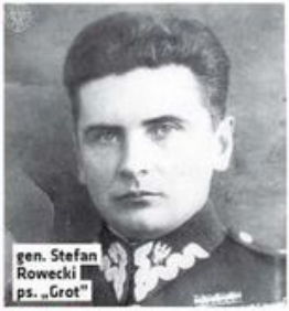
gen. Stefan Rowecki ps. „Grot”

Dr Karol Nawrocki, prezes Instytutu Pamięci Narodowej