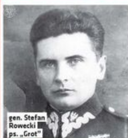
gen. Stefan Rowecki ps. „Grot”

Dr Karol Nawrocki, prezes Instytutu Pamięci Narodowej