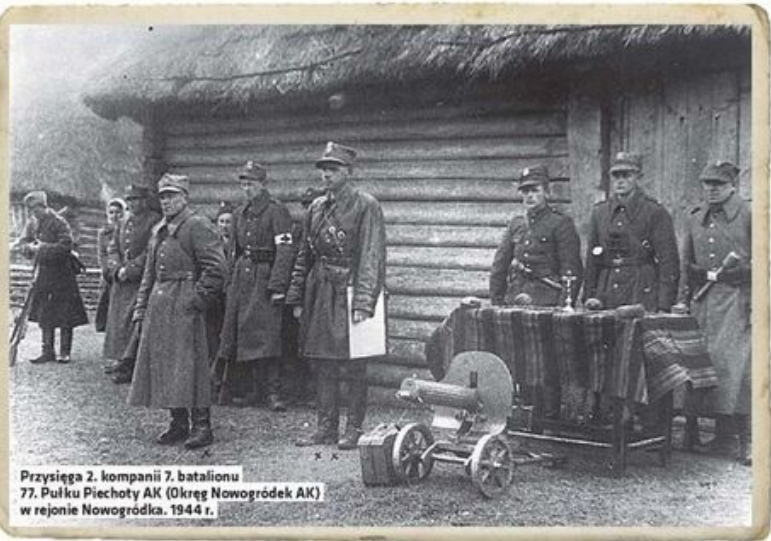
Przysięga 2. kompanii 7. batalionu 77. Pułku Piechoty AK (Okręg Nowogródek AK) w rejonie Nowogródka, 1944 r.

Żołnierze AK przygotowywali również powstanie powszechne w ramach akcji „Burza”, które miało pokazać nadszarpniętej Armii Czerwonej, że Polacy