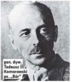
gen. dyw. Tadeusz Komorowski ps. „Bór”

G dyby ktoś mnie pytał o ważne daty z okresu 1939–1945, to uważam, że 14 lutego 1942 r. jest jedną z nich. Tego dnia Naczelný Wódz, gen. Władysław Sikorski, przekształcił Związek Walki Zbrojnej w Armię Krajową i mianował jej dowódcą gen. Stefana Roweckiego.