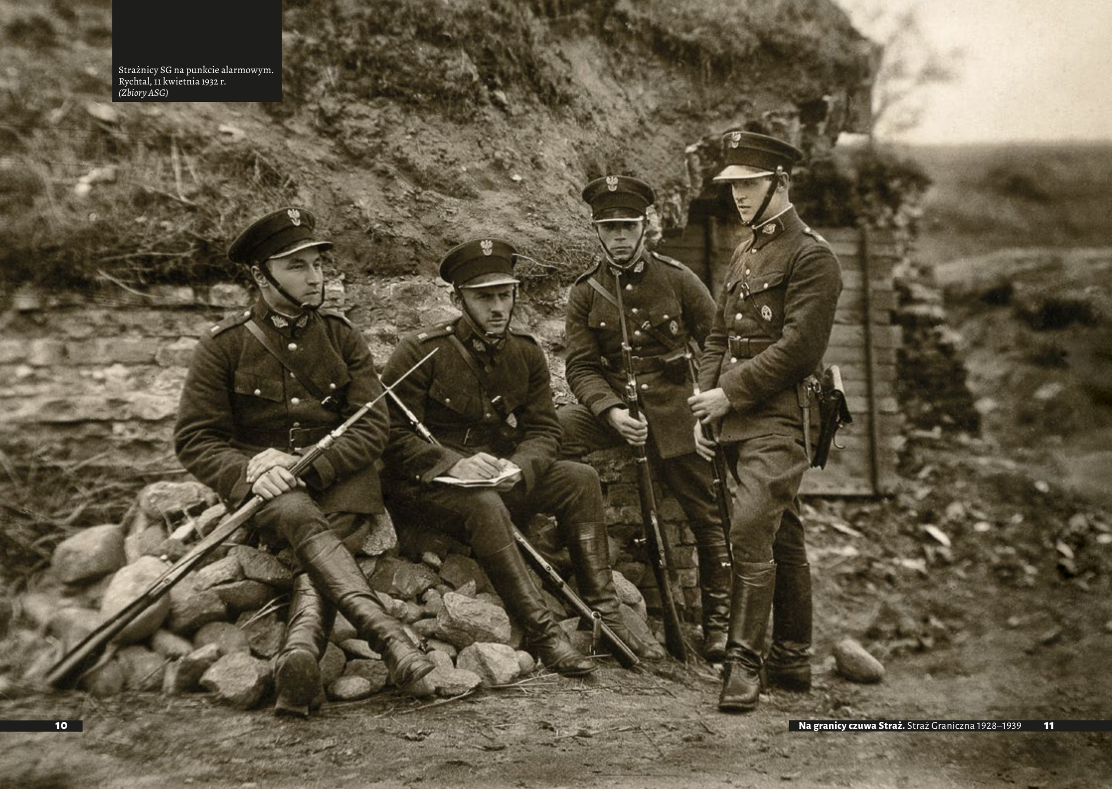
Strażnicy SG na punkcie alarmowym. Rychtal, 11 kwietnia 1932 r.