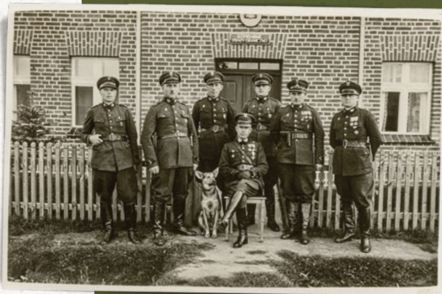
Strażnicy i kierownik Placówki II linii przed budynkiem Komisariatu SG „Rychtał” (Wielkopolski Inspektorat Okręgowy SG). Lata trzydzieste