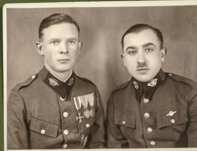
Strażnicy SG. Na patkach kołnierza charakterystyczne metalowe emblematy SG: orły państwowe i liście palmowe. Lata trzydzieste

W sierpniu 1933 r. wprowadzono w SG wojskowe przepisy mundurowe (z okresem przejściowym do 31 grudnia 1937 r.); dla odróżnienia na ciemnozielonych patkach kołnierza kurtek (dla oficerów aksamitne) z jasnozieloną wypustką typu wojskowego naszywano wężyzk przetykany zieloną nicią. Na patkach noszono oznakę biały oksydowany orzeł państwowy wz. 1927 na tarczy trójkątnej, metalowy dla szeregowych, haftowany dla oficerów. Na kołnierzach płaszczy nadal naszywane były paski dwubarwne: jasnozielony (górny), ciemnozielony (dolny). Nadal noszono czapki okrągłe z jasnozieloną wypustką i ciemnozielonym otokiem, ale z orłem na tarczy wg wzoru obowiązującego w WP.