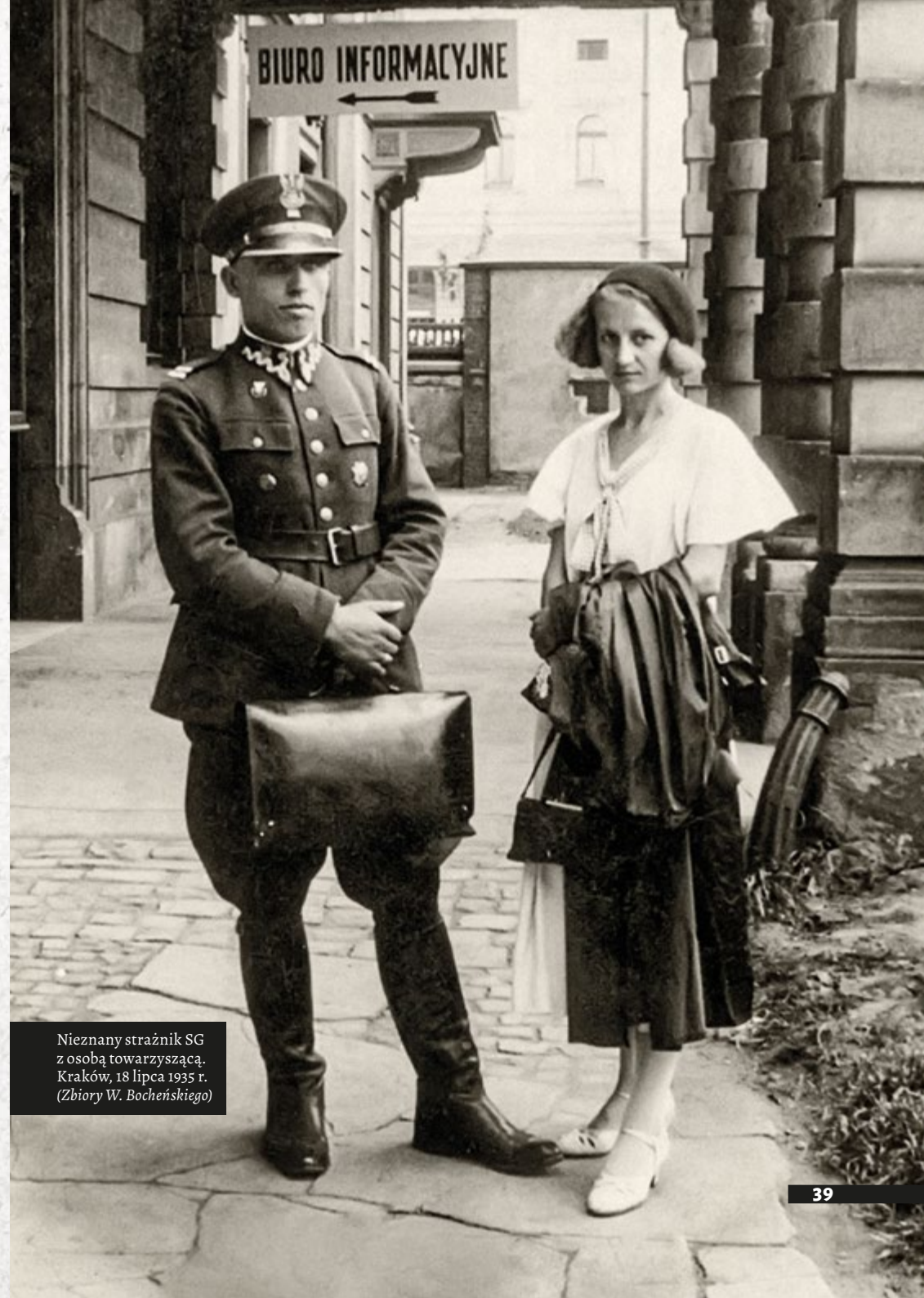
Nieznany strażnik SG z osobą towarzyszącą. Kraków, 18 lipca 1935 r.