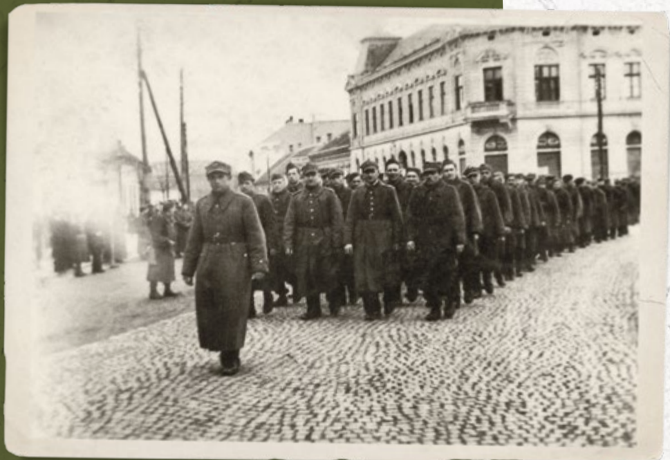
Grupa polskich żołnierzy (wśród nich strażnicy SG) internowanych na Węgrzech. Powrót z kościoła. Wielkanoc, 24 lutego 1940 r.