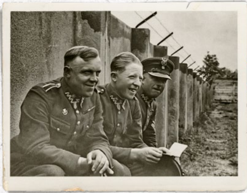
Strażnicy SG po służbie. Lata trzydzieste

zblizone były do kar w siłach zbrojnych. Żony i dzieci funkcjonariuszy SG mogły podjąć pracę tylko za zgodą przełożonego, pod warunkiem że nie naruszała godności „munduru”. Strażnicy mieli prawo do urlopu wypoczynkowego zależnie od stażu (4-6 tygodni w roku) i urlopu okolicznościowego. Nabywali prawa emerytalne (po 10 latach – 40 proc. uposażenia i 2,4 proc. za każdy kolejny rok), a wdowy i sieroty po nich otrzymywały zaopatrzenie „wdowie”. Strażnikom po przesłużeniu 5 lat następne lata liczono do emerytury jako 16 miesięcy na rok. W stan spoczynku przenoszono ze względu na trwałą niezdolność do służby po ukończeniu 60 lat lub po 55 roku życia, gdy strażnik nabył już prawo do pełnej emerytury. Odchodzącym pomagano w uzyskaniu posady w administracji państwowej, m.in. w PKP, w Ministerstwie Poczty i Telegrafów. Opiekę zdrowotną nad strażnikami i członkami ich rodzin sprawowała wojskowa służba zdrowia.