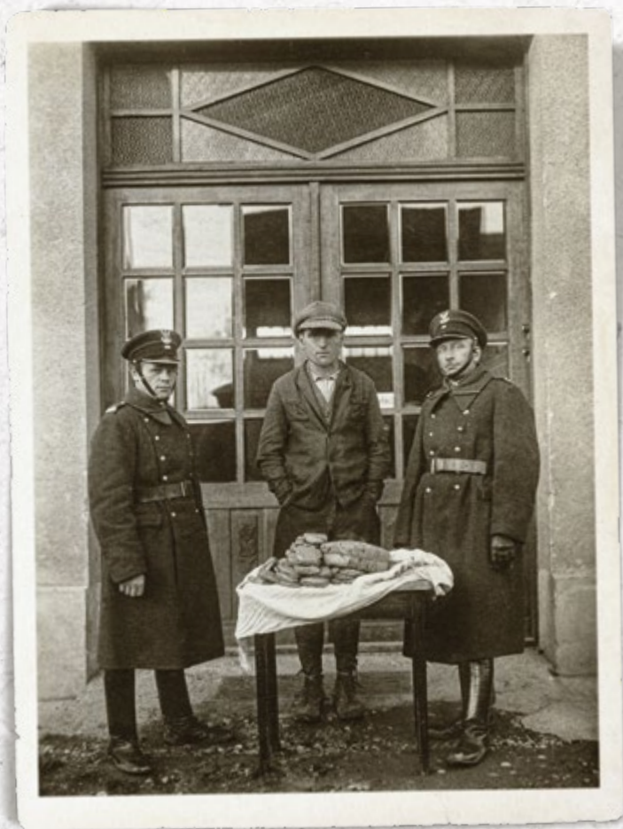
Przemysł tytoniu zatrzymany przez strażników SG. Lata trzydzieste

przynoszące zysk, m.in. zwierzęta, wyroby metalowe, alkohol i eter, tytoń, rowery, motocykle, pieprz i przyprawy, rodzyunki, narkotyki, a nawet dewocjonalia. Początkowo ścigano tylko sprawców zatrzymanego przemytu, w latach trzydziestych także sprawców przemytu udowodnionego. Zwalczano również wymyt, tj. nielegalny wywóz towarów, m.in. zboża, drobiu, wędlin, bydła i świń, ale w ramach wspomnianej „wojny celnej” z Niemcami tolerowano wywóz tytoniu.