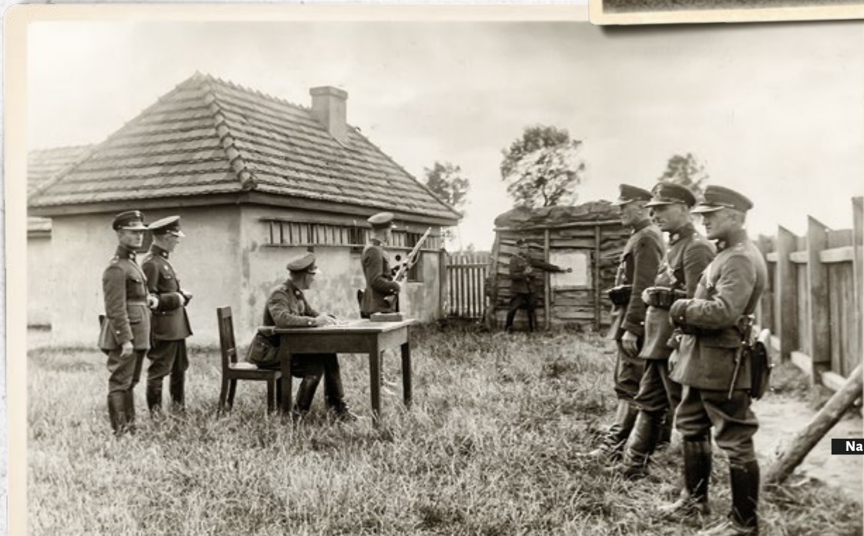
Strażnicy SG na strzelniczy małokalibrowej na Placówce SG „Rybin” (Komisariat SG „Kobyła Góra”). Lata trzydzieste