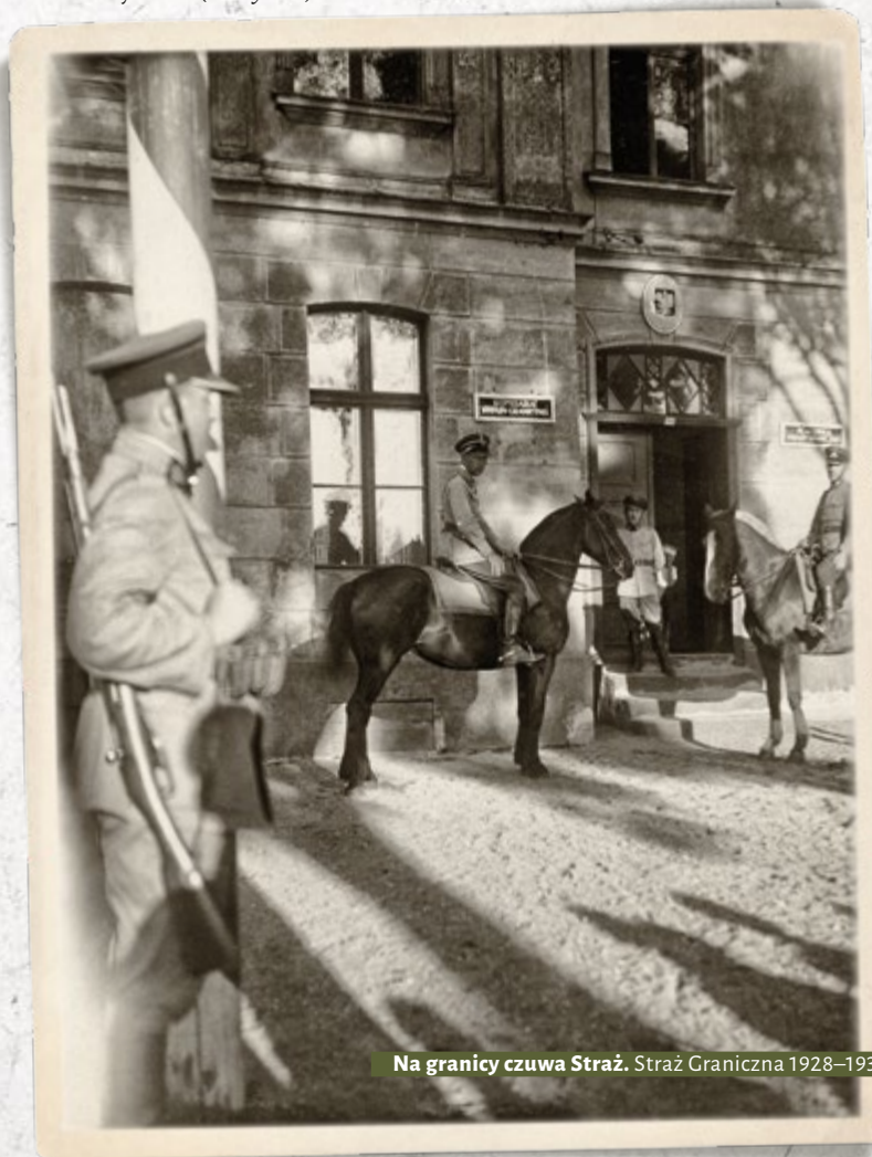
Strażnicy SG przed budynkiem komisariatu. U stojącego strażnika widoczny karabinek „Mosin”. Wielkopolski Inspektorat Okręgowy SG. Lata trzydzieste

na ręczne karabiny maszynowe (rkm) wz. 1928 systemu Browning. W 1938 r. wprowadzono ckm wz. 1930 systemu Browning-Colt polskiej produkcji. Na przełomie 1938/1939 do części komisariatów wprowadzono broń automatyczną. W 1939 r. SG uzbrojona była: w 15 352 kbk, 491 rkm wz. 1928 „Browning”, nieznaną liczbę lkm i ckm („Maxim” wz. 1908/15 i 1908), 8 armat wz. 1885 kal. 37 mm i 2064 pistolety.