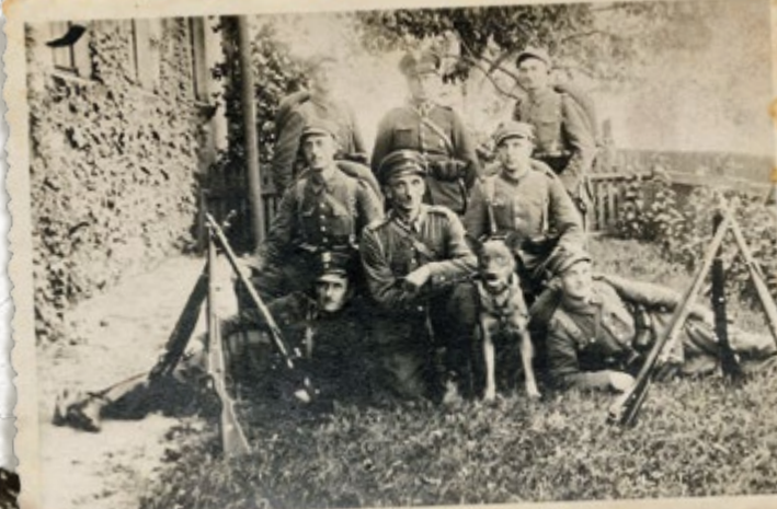
Strażnicy SG i żołnierze z plutonu wzmocnienia SG, 1939 r.