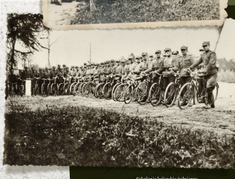
Szkolenie kolarskie żołnierzy z plutonów wzmocnienia SG. Bronikowo (Wielkopolska) 1939 r.