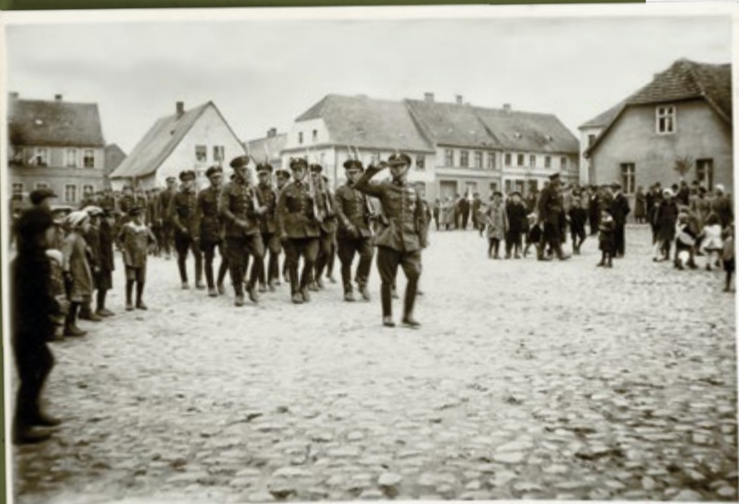
Przemarsz pododdziału SG podczas uroczystości w Krotoszynie, 19 marca 1932 r.