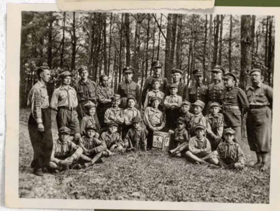
Grupa harcerzy pod opieką strażników z Inspektoratu Granicznego SG „Ostrów”. Lata trzydzieste