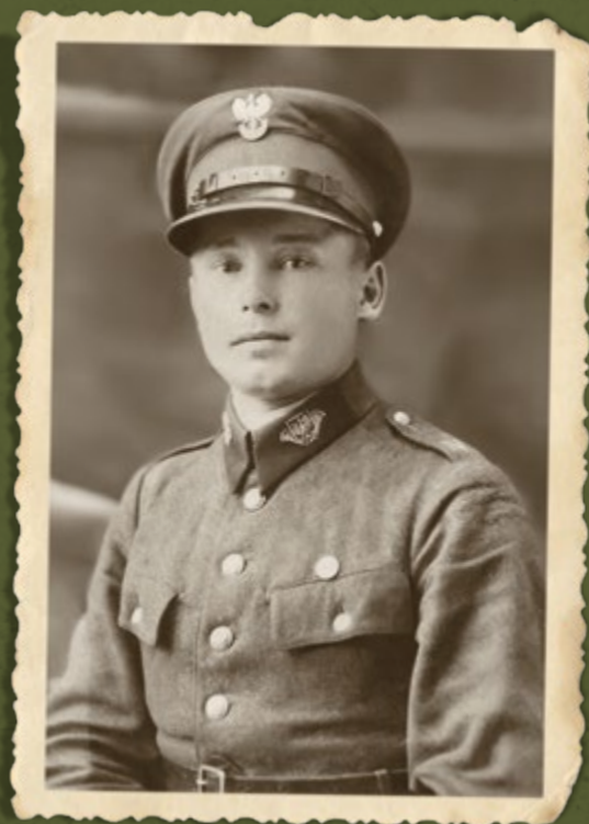
Nieznany strażnik SG ze Śląskiego Inspektoratu Okręgowego SG. Na czapce orzełek SG. Lata trzydzieste (Zbiory W. Bocheńskiego)

Oznaki stopni służbowych przeniesiono z rękawów na naramienniki (okres przejściowy do 11 listopada 1933 r.). Galony w oznakach stopni z brzegami barwy jasnozielonej: strażnik – dwa galony naszyte w poprzek naramiennika i poziomo na otoku czapki pod orłem, st. strażnik – trzy galony w poprzek naramiennika i na otoku, przodownik – galon wzdłuż brzegów naramiennika (za wyjątkiem przy wszytciu rękawa) oraz galon w kształcie kąta ostrego z wierzchołkiem do dołu na otoku czapki; st. przodownik – dodatkowy galon przez środek naramiennika oraz dwa galony na otoku. Dla oficerów niższych oznaczeniem stopnia był galon-sznurek wokół górnej krawędzi otoku i gwiazdki: aspirant – jedna na naramiennikach i na otoku pod orłem, podkomisarz – dwie, komisarz – trzy. Dla oficerów wyższych dwa galony-sznurek wzdłuż górnej krawędzi otoku, dwa galony w poprzek naramiennika i gwiazdki: nadkomisarz – jedna, inspektor – dwie, nadinspektor – trzy.