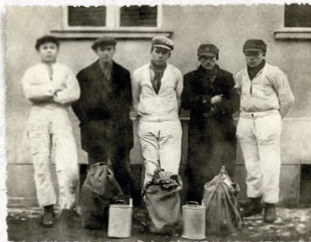
Przemysł alkoholu i strażnicy SG (w białych strojach maskujących). Przed nimi „blachany” na alkohol. Lata trzydzieste (Zbiory ASG)