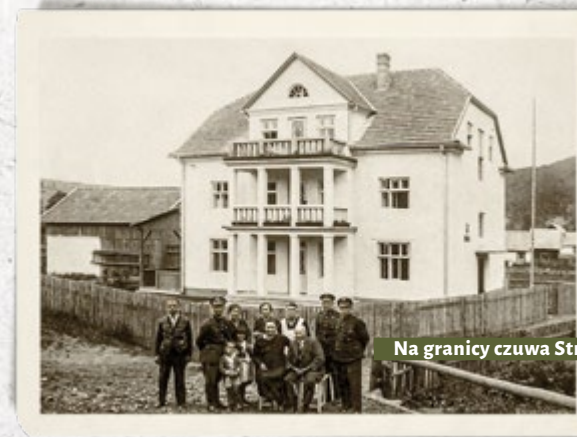
Strażnicy SG z rodzinami przed budynkiem Komisariatu SG „Rajcza” (Inspektorat Graniczny SG „Bielsko”). Lata trzydzieste

SG po utworzeniu w 1928 r. przejęła infrastrukturę graniczną i budynki po Straży Celnej. Były to głównie strażnice, a nawet ziemianki, które wybudowano doraźnie w latach 1918-1928. Tylko na granicy polsko-niemieckiej (odcinek pruski) przejęto kilka budynków tzw. pokordonowych. Większość placówek i komisariatów SG (75,5 proc.) umieszczono w dzierżawionych budynkach prywatnych, położonych w pobliżu granicy. Czasami były to jednopokojowe pomieszczenia przy rodzinach właścicieli. Wprawdzie w pierwszych latach rozpoczęto budowę kilkunastu strażnic, ale trudności finansowe państwa sprawiły, że plany te zostały zawieszono. Dopiero w latach trzydziestych przystąpiono do budowy nowych, na gruntach uzyskanych od Ministerstwa Rolnictwa. Wznoszone budynki SG były wielofunkcyjne i miały zabezpieczyć potrzeby komisariatów i placówek. Planowane były w nich: mieszkanie służbowe komendanta z gabinetem (parter), gabinet kwatermistrza, pokój oficera wywiadu, kancelaria placówki II linii (wywiadu), kancelaria ogólna, radiostacja, laboratorium fotograficzne (piętro), magazyny, rusznikarnia i pralnia (w piwnica). Przykładem takich budynków są zachowane do dziś budynki strażnic w Chorzelach, Zielkowie, Kaczcach, Wiśle, Boguszowicach. Dla ograniczenia kosztów w budynkach SG lokowano zazwyczaj także placówki Urzędów Celnych.