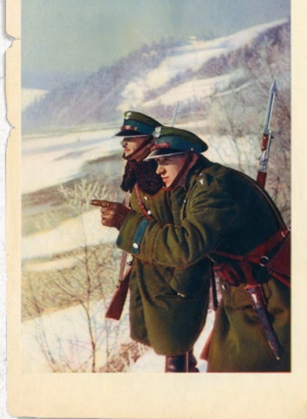
Zimowy patrol SG nad Popradem (Małopolski Inspektorat Okręgowy SG). Lata trzydzieste