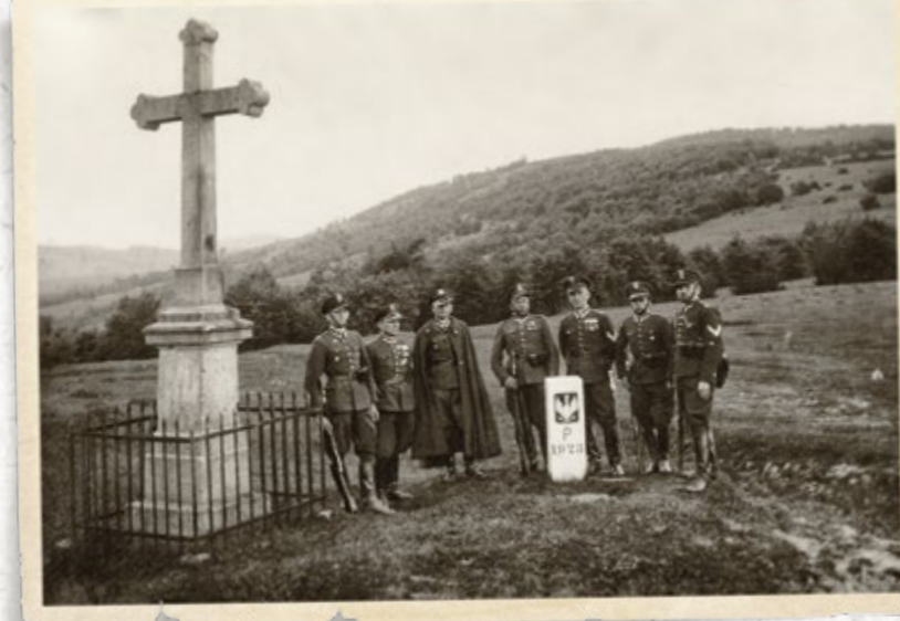
Strażnicy SG przy znaku granicznym na granicy polsko-czechosłowackiej. Fot. Stanisław Terlecki, Rymanów 1937 r. (Zbiory W. Bocheńskiego)