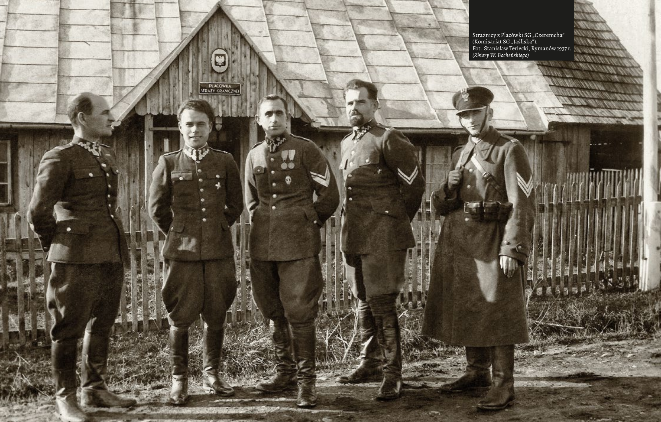
Strażnicy z Placówki SG „Czeremcha” (Komisariat SG „Jaśliska”). Rymanów 1937 r.