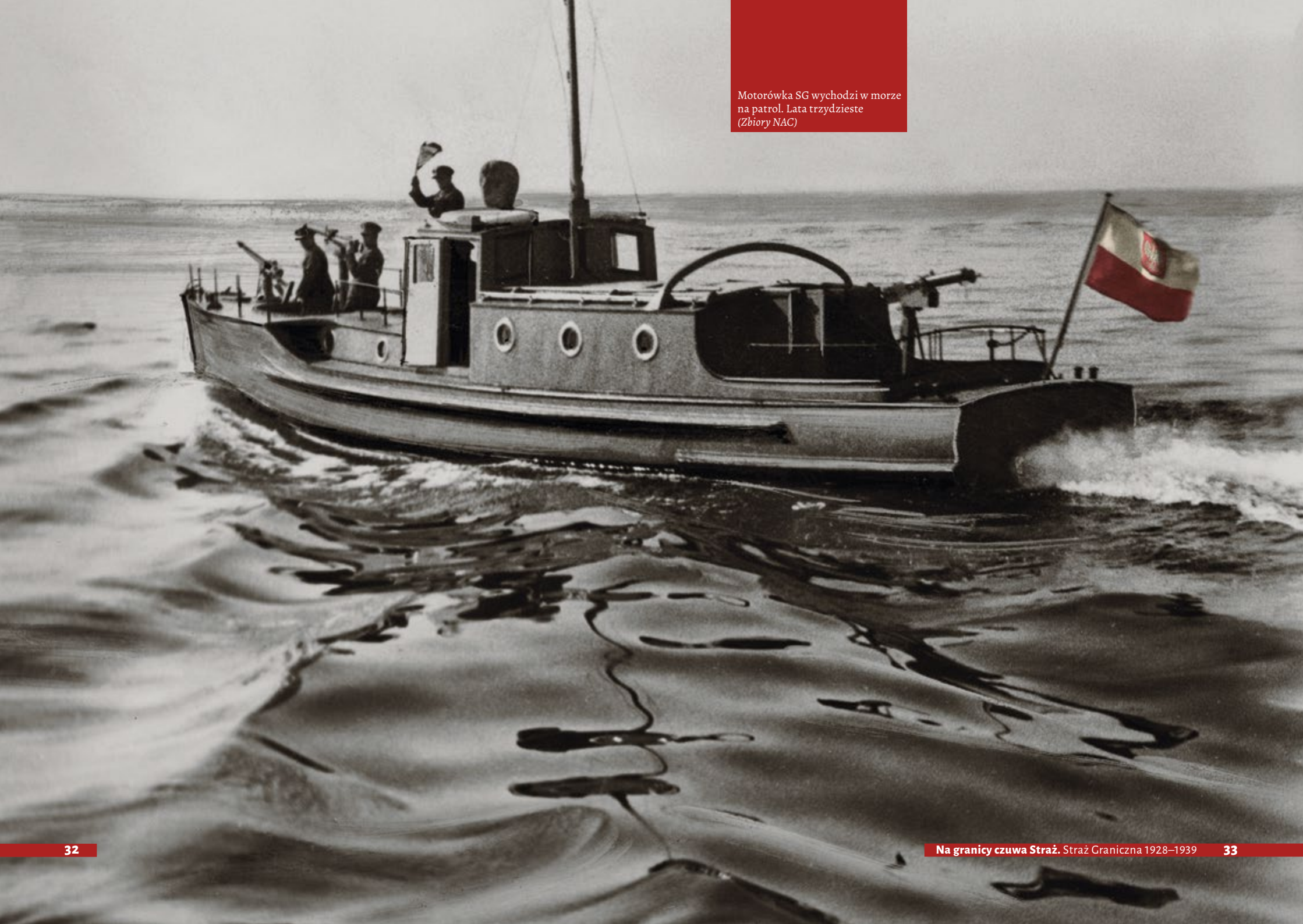
Motorówka SG wychodzi w morze na patrol. Lata trzydzieste