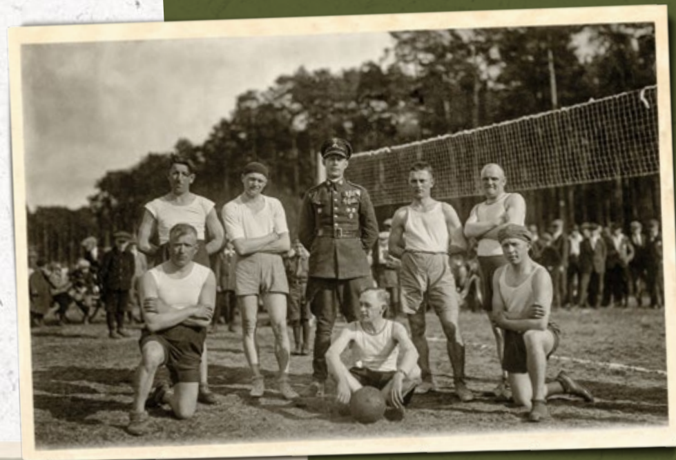
Drużyna siatkówki Komisariatu SG „Sośnie” (Inspektorat Graniczny SG „Ostrów”). Lata trzydzieste

Strażników SG dla utrzymania dobrej kondycji i sprawności zachęcano do uprawiania sportów, organizując dla nich zajęcia m.in. z zakresu szermierki, gier zespołowych i lekkoatletyki. Zajęcia w tym zakresie organizowano m.in. podczas szkoleń w CSSG w Kalwarii (następnie w Rawie Ruskiej). Strażnicy SG uczestniczyli m.in. w sztafetowych biegach rozstawnych organizowanych przez KOP i SG wzdłuż granic państwa. Brali także udział w zawodach marszowych (m.in. „Sulejówek – Warszawa” i „Szlakiem Kadrowki”) oraz w przejściach narciarskich (m.in. „Zulów – Wilno”). Strażnicy pełniący służbę na terenach górskich doskonalili swoje umiejętności narciarskie przydatne w ochronie granicy. Ważnym elementem wychowania fizycznego było strzelectwo, które prowadzono w ramach obowiązkowych szkoleń oraz zawodów organizowanych m.in. przez Związek Strzelecki i Przysposobienie Wojskowe.