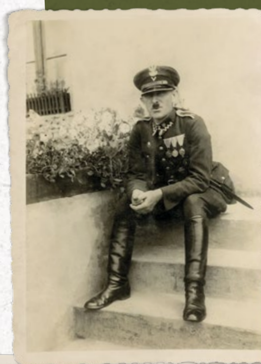
Nieznany przodownik SG z Mazowieckiego Inspektoratu Okręgowego SG. Lata trzydzieste

Zgodnie z rozporządzeniem Prezydenta RP z 22 marca 1928 r. o Straży Granicznej głównym zadaniem SG było przeciwdziałanie nielegalnemu ruchowi osobowemu i towarowemu na granicach, w tym także na wodach granicznych i granicy morskiej, śledzenie i ujawnianie przemytnictwa na odcinkach tzw. „zielonej granicy” oraz innych