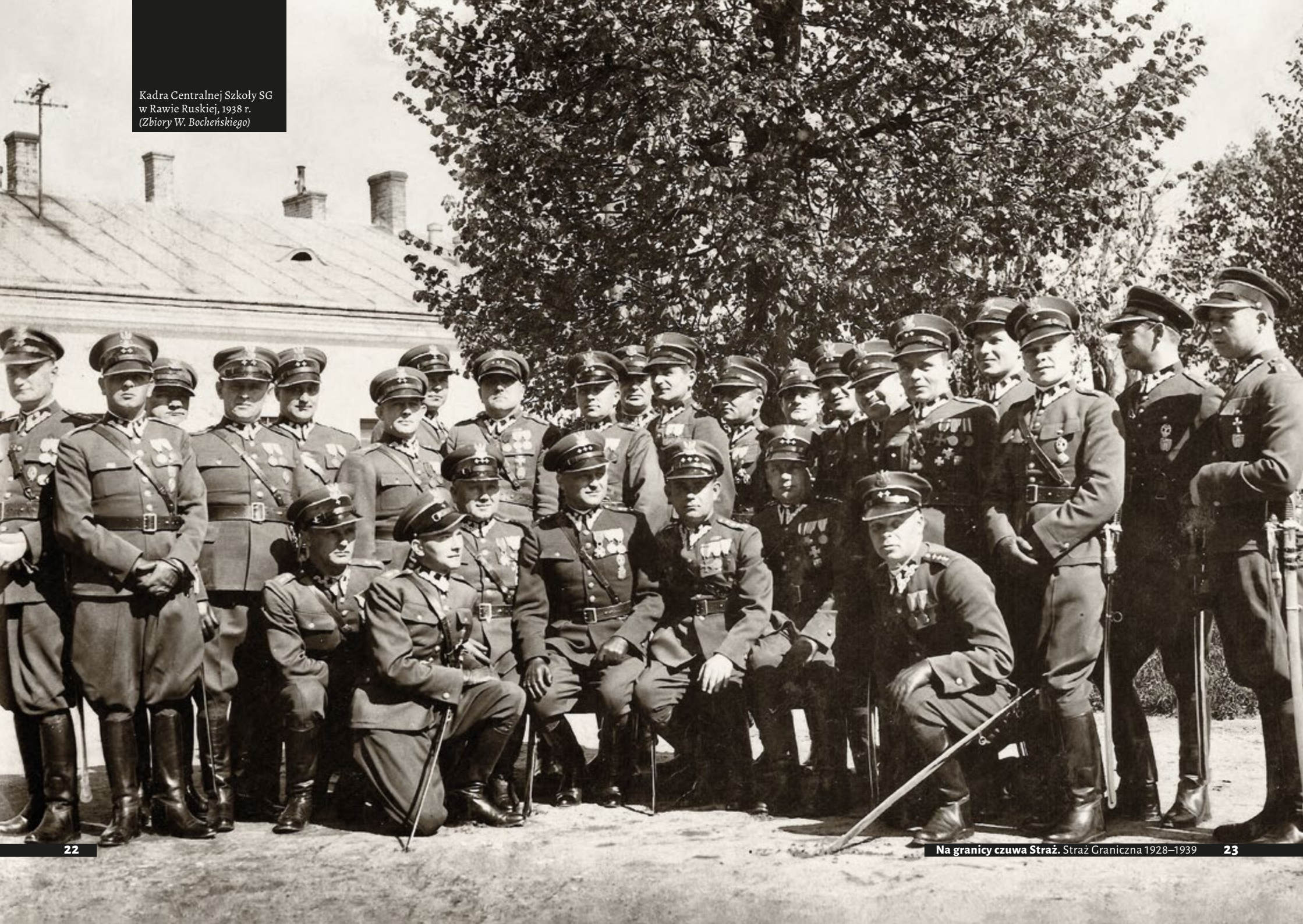
Kadra Centralnej Szkoły SG w Rawie Ruskiej, 1938 r.