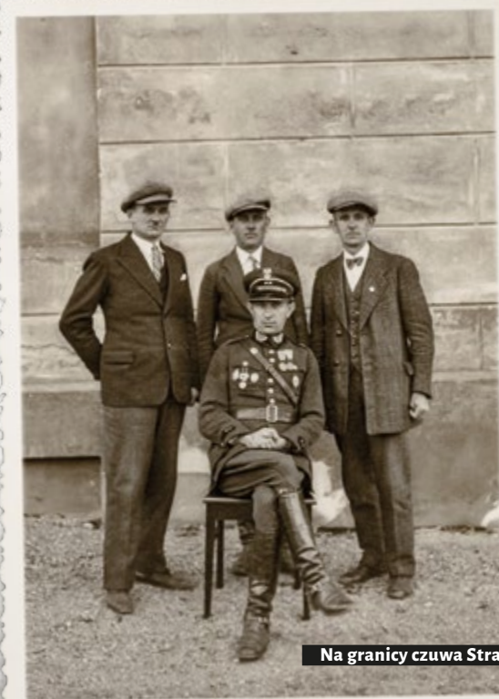
Wywiadowcy SG i kierownik Placówki II linii (wywiadowczej) „Rychtał”. Lata trzydzieste