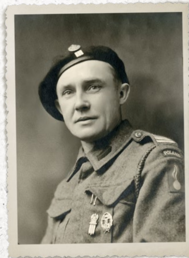
Plutonowy (st. strażnik SG) – żołnierz Polskich Sił Zbrojnych na Zachodzie. Na mundurze odznaka pamiątkowa SG i odznaka z Dywizji Strzelców Pieszych

funkcjonariusze SG jako potencjalni współpracownicy wywiadu (tzw. „dwojkarze”) byli inwigilowani przez UB, m.in. w ramach ogólnopolskiego rozpracowania krypt. „Targowica”.