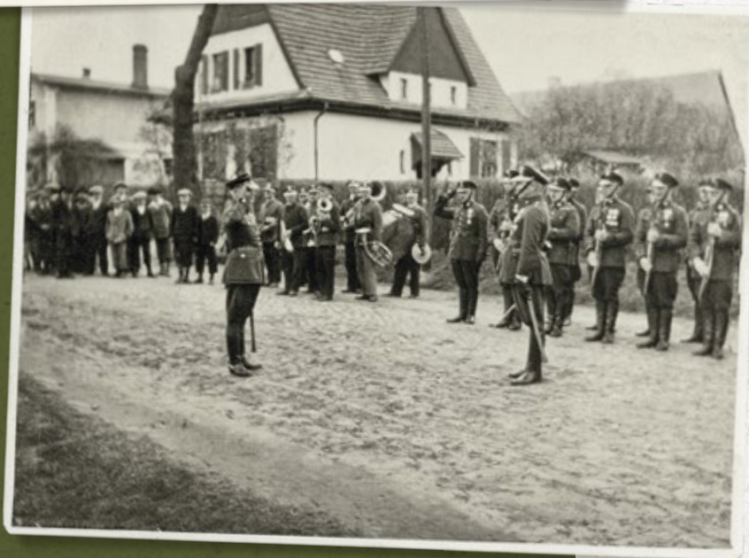
Raport dowódcy plutonu SG z Komisariatu SG „Laski” podczas uroczystości święta 3 Maja. Lata trzydzieste