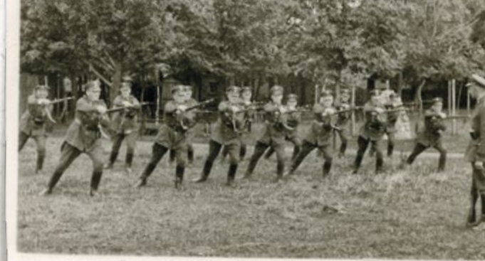
Strażnicy SG podczas ćwiczeń walki bronią. Lata trzydzieste