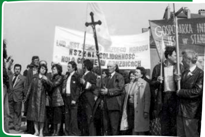
Grupa manifestantów na Starym Mieście w Warszawie w dniu rejestracji NSZZ RI „Solidarność”. Warszawa, 12 maja 1981 r.

KRYZYS BYDGOSKI W MARCU 1981 R. BYŁ NAJPOWAŻNIEJSZYM KONFLIKTEM NA LINII WŁADZA–SPOŁECZEŃSTWO W OKRESIE POPRZEDZAJĄCYM REJESTRACJĘ NSZZ RI „SOLIDARNOSC”.