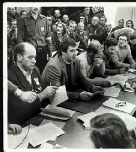
Ogólnopolski Komitet Strajkowy w Siedlcach podczas głosowania nad wyborem miejsca, gdzie miały odbywać się negocjacje z komisją rządową, 19 listopada 1981 r.