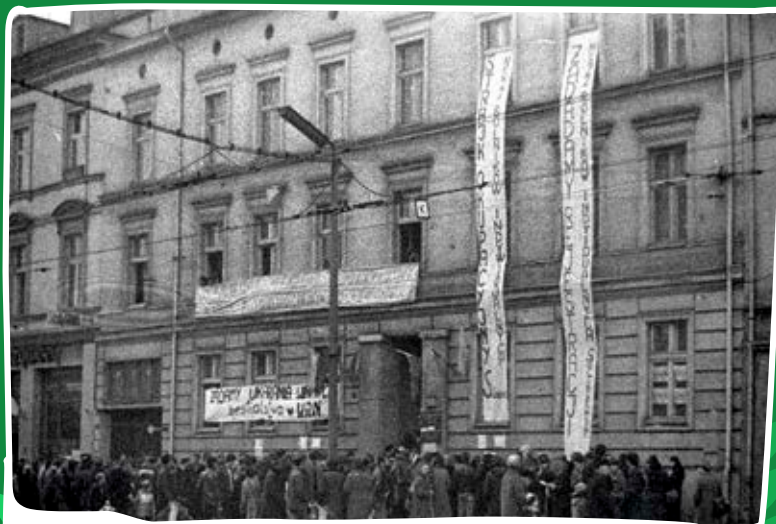
Budynek Wojewódzkiego Komitetu ZSL w Bydgoszczy podczas strajku okupacyjnego rolników indywidualnych, marzec 1981 r.