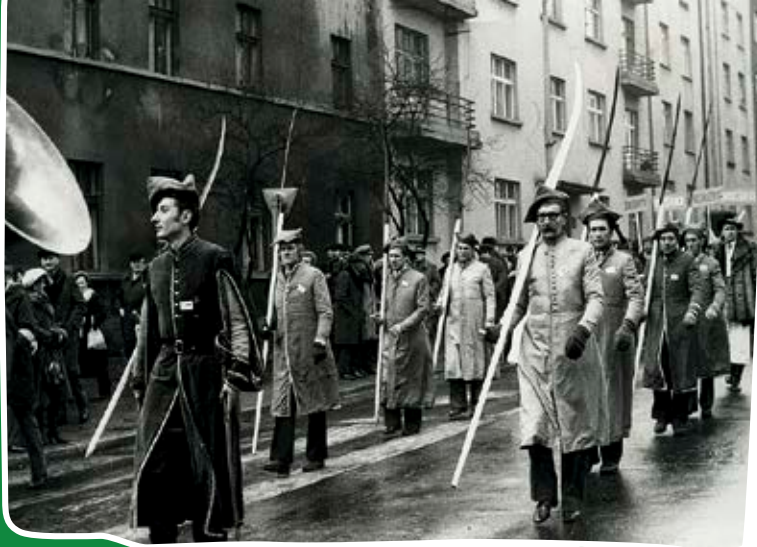
Marsz działaczy rolniczych z kościoła pw. św. Wincentego à Paulo na Stary Rynek w Bydgoszczy, 8 lutego 1981 r.