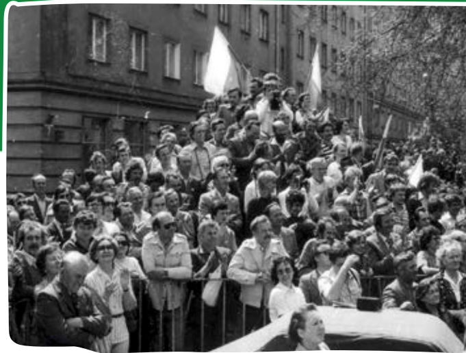
Manifestacja 12 maja 1981 r. w Warszawie, w dniu zarejestrowania przez Sąd Wojewódzki Niezależnego Samorządnego Związku Zawodowego RI „Solidarność”.