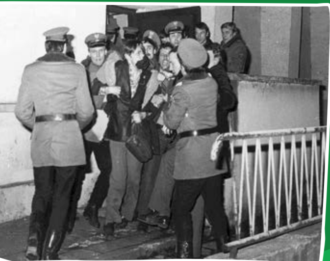
Tylne wyjście z gmachu Urzędu Wojewódzkiego: funkcjonariusze Milicji Obywatelskiej usuwają siłą działaczy „Solidarności” z sali obrad. Bydgoszcz, 19 marca 1981 r.

W marcu 1981 r. głównym ośrodkiem rolniczych protestów stała się Bydgoszcz. Podczas interwencji milicji pobito trzech działaczy związkowych. Doprowadziło to do ogólnopolskiego strajku ostrzegawczego i w efekcie podpisania porozumienia warszawskiego, które zapowiadało rejestrację NSZZ RI „Solidarność”, co nastąpiło 12 maja 1981 r. W Warszawie zebrało się ok. 20 tys. chłopów, którzy po Mszy św. w Katedrze św. Jana złożyli wieniec przy Grobie Nieznanego Żołnierza. Częstym motywem, do którego odwoływała się NSZZ RI „Solidarność” – licząca ok. 800 tys. członków – była tradycja insurekcji kościuszkowskiej z dewizą „Żywią i Bronią” umieszczaną w prasie i na związkowych sztandarach.