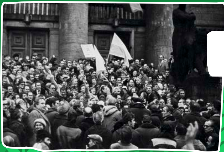
Uczestnicy zjazdu zjednoczeniowego, podczas którego powołano NSZZ RI „Solidarność”. Poznań, 1981 r. Ogólnopolski Zjazd Delegatów NSZZ Rolników Indywidualnych w Poznaniu w marcu 1981 r.