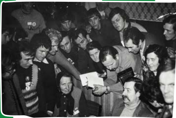
Strajk chłopski w Domu Kolejarza (w budynku b. WRZZ) w Rzeszowie, styczeń–luty 1981 r. Spotkanie strajkujących z Lechem Wałęsą, przewodniczącym NSZZ „Solidarność”.

POROZUMIENIA Z RZESZOWA I USTRZYK DOLNYCH ZAWIERAŁY OSIEM DZIAŁÓW: GOSPODARKA ZIEMIĄ, INWESTYCJE ROLNICZE I ZAOPATRZENIE ROLNICTWA, CENY PRODUKTÓW ROLNYCH, SKUP I KONTRAKTACJA, SPRAWY SOCJALNE WSI, ADMINISTRACJA GMIN, SZKOLNICTWO I RELIGIA, GWARANCJE PRAWNE (GWARANCJE BEZPIECZEŃSTWA DLA UCZESTNIKÓW AKCJI STRAJKOWEJ) I USTALENIA KOŃCOWE. INTEGRALNĄ CZĘŚCIĄ POROZUMIENIA JEST UMOWA DOTYCZĄCA LOKALNYCH SPRAW BIESZCZAD.