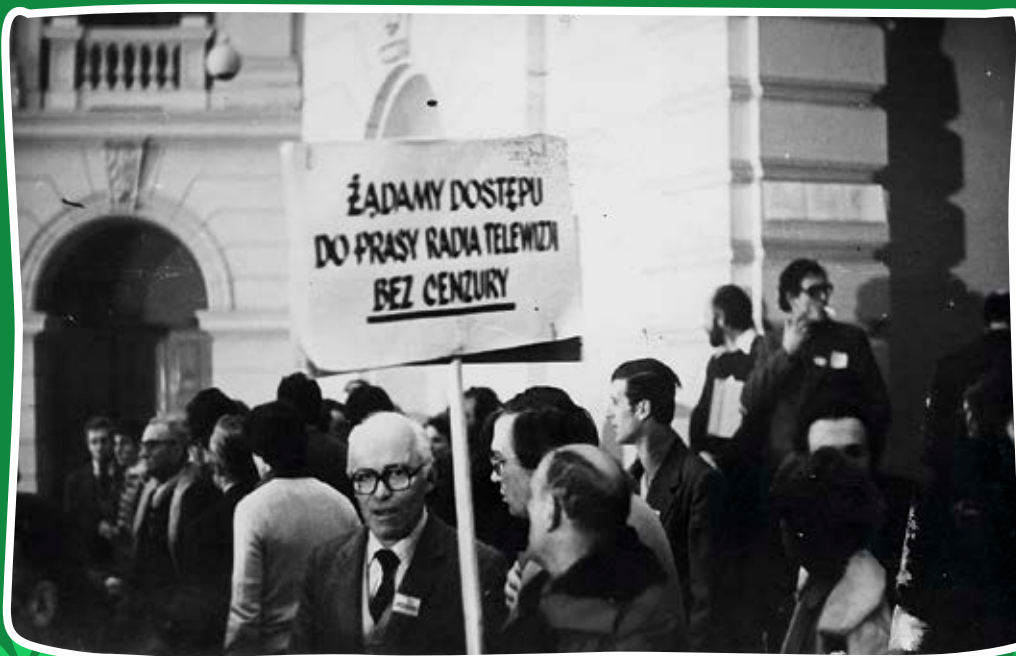
Zjazd Delegatów NSZZ „Solidarność Wiejska”. Warszawa, 14 grudnia 1980 r.

Robotnicze protesty 1980 r. przyniosły również ożywienie na wsi, gdzie zaczęły powstawać struktury niezależnych związków. Nie udało się jednak wyłonić jednej reprezentacji – inicjatywy związkowe skupiały się wokół „Solidarności Wiejskiej”, „Solidarności Chłopskiej”, Związku Producentów Rolnych. Jesienią 1980 r. wszystkie ich wnioski o rejestrację zostały przez sądy odrzucone, co było przyczyną kolejnych protestów m.in. w Ustrzykach Dolnych, Rzeszowie, Świdnicy. Niezależny ruch związkowy na wsi uzyskał organizacyjne i polityczne poparcie NSZZ „Solidarność” oraz Kościoła, a szczególnie Prymasa kard. Stefana Wyszyńskiego, który wielokrotnie występował w tej sprawie i podkreślał, że prawo do zrzeszania ludności wiejskiej jest prawem naturalnym. W poparcie dla powstających struktur angażowali się księża w wiejskich parafiach.