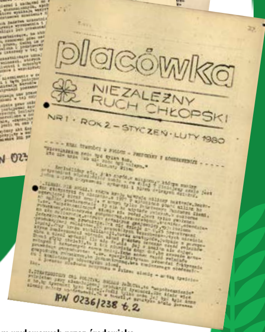
Winyety pism wydawanych przez środowisko niezależnego ruchu chłopskiego. (AIPN)