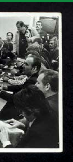
Rozmowy strajkujących przedstawicieli NSZZ RI „Solidarność” z władzami. Siedlce, 27 listopada 1981 r.