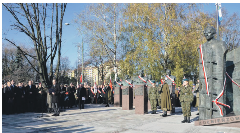
Odsłonicie pomnika płk. Łukasza Cieplińskiego i IV Zarządu Głównego WiN w Rzeszowie 17 listopada 2013 r.

W czasie wojny obronnej, 17 września 1939 r. pod Brochowem w trakcie bitwy nad Burzą, wykazując się odwagą zniszczył co najmniej sześć niemieckich czołgów, w krytycznej sytuacji zatrzymując natarcie wroga, umożliwiając tym samym przeprawę oddziałów WP cofających się w kierunku Warszawy. Za ten czyn