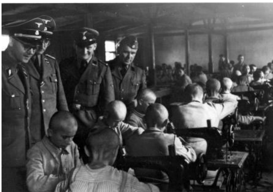
Немецкие функционеры инспектируют швейную мастерскую в лагере.

«Сначала мы не осознавали, какой это лагерь и какие будут здесь условия, поскольку этих условий мы не знали. Чем дольше мы здесь были, тем более жесткой становилась дисциплина и тем легче было заметить, что все это ведет к тому, чтобы нас замучить, извести».