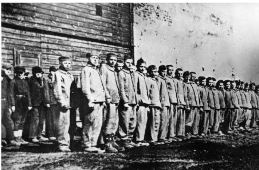
Поверка заключенных (Архив ИНП, Отдел в Лодзи).

В июне 1942 г. от Лодзинского гетто немцы отделили 5-гектарный участок, предназначив его для трудового лагеря для польских детей. Закрытая зона находилась в гетто в квартале сегодняшних улиц Гурнича ( Robert Straße ), Эмилии Плятер ( Max Straße ), Брацка ( Ewald Straße ) и Пшемыслова ( Gewerbe Straße ).