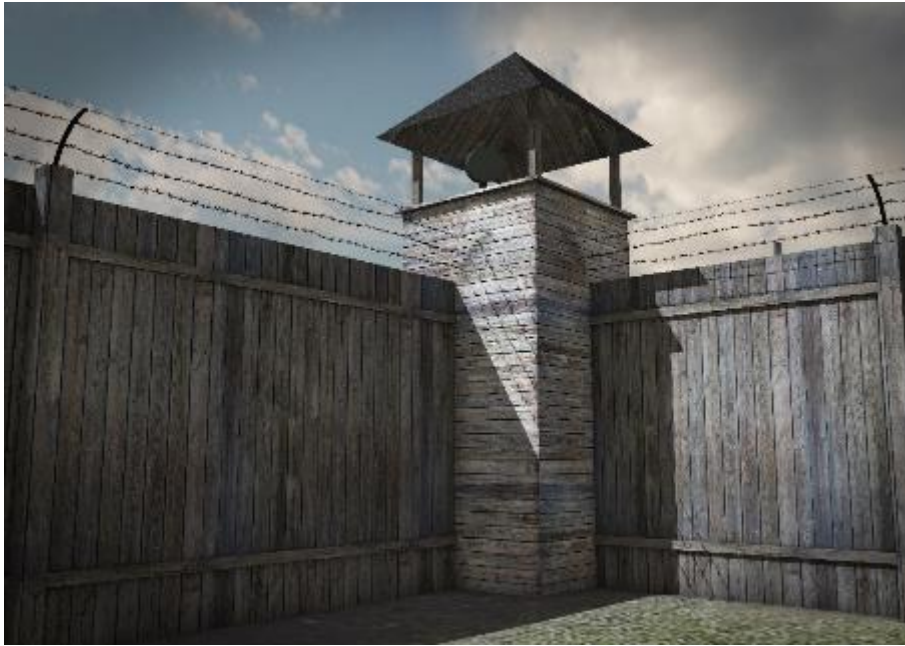
Реконструированная сторожевая вышка с оградой (пункт «W»).

С трех сторон был воздвигнут трехметровый забор из плотно примыкавших друг к другу досок, наверху которого разместили колючую проволоку. Со стороны примыкавшего к лагерю еврейского кладбища преградой была кирпичная стена, которую надстроили до уровня деревянного забора. Главные ворота находились в начале ул. Пшемыслова, которая до войны доходила только до ул. Брацка, но с ней не скрещивалась. А вот в лагерных условиях ул. Пшемыслова удлиннили и превратили в т. н. Lager Straße , т. е. главную лагерную аллею, которую дети укрепили щебнем и шлаком. В этом месте проходили проверки и обычно именно здесь наказывали заключенных. Аллея проходила в направлении ул. Гурнича, на которой, в свою очередь, находились ворота поменьше для еврейских рабочих, телег со снабжением и фургонов, вывозивших больных детей в больницу или их тела на католическое кладбище св. Войцеха на ул. Курчаки 81. Третьи наружные ворота располагались со стороны ул. Брацка и проходили по оси нынешней ул. Тадеуша Мостовского ( Roderich Straße ). Недалеко от них устроили караульную, и именно сюда, начиная с 1944 г., приводили детей на свидание с родителями. Внутри лагеря находились еще одни ворота, через которые можно было попасть из главного лагеря в подлагерь для девочек.