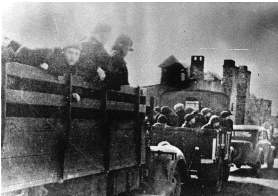
Перевозка заключенных с Вокзала «Лодзь-Калиска» в лагерь.

Немцы планировали, что единовременно лагерь вместит две тысячи заключенных, но самое большое наполнение отметили до лета 1944 г., когда в лагере были зарегистрированы ок. тысячи двухсот заключенных. Из этого числа надо, однако, вычсть свыше сотни девушек, которые, начиная с весны 1943 г., были направлены в земледельческий филиал лагеря в селе Дзержонзна недалеко от Згежа. Таким образом немецкие власти получили возможность обеспечить лагерь независимость от поставок продовольствия извне. Начиная с половины 1944 г., из лагеря выпускали все больше детей. Часть из них освобождалась благодаря родителям, которые подписывали фолькслист, других же направляли на работу в лодзинские фабрики или в немецкие предприятия в глубине Третьего рейха.