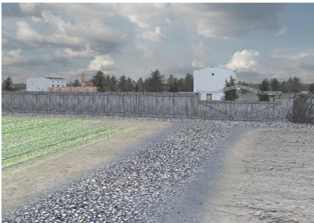
Реконструированные главные ворота на ул. Пшемыслова 27 в Лодзи (пункт «Е»), через которые на территорию лагеря въезжали новоприбывшие заключенные (Мультимедийная карта немецкого трудового лагеря для польских детей на ул. Пшемыслова в Лодзи/ИНП, Отдел в Лодзи).

Окружная комиссия по исследованию гитлеровских преступлений в Лодзи постепенно снижала число заключенных лагеря, а также число его жертв. Согласно окончательным данным, в немецком лагере в Лодзи пребывали от 2000 до свыше 3000 польских детей. Число умерших и убитых в лагере не превысило 200 человек, хотя известны имена и фамилии лишь трети из его жертв. Независимо от этого история немецкого трудового лагеря для польских детей на ул. Пшемыслова в Лодзи требует дальнейших исследований и популяризации, чтобы память о нем сохранилась среди будущих поколений и чтобы истории его жертв стали известными современному поколению.