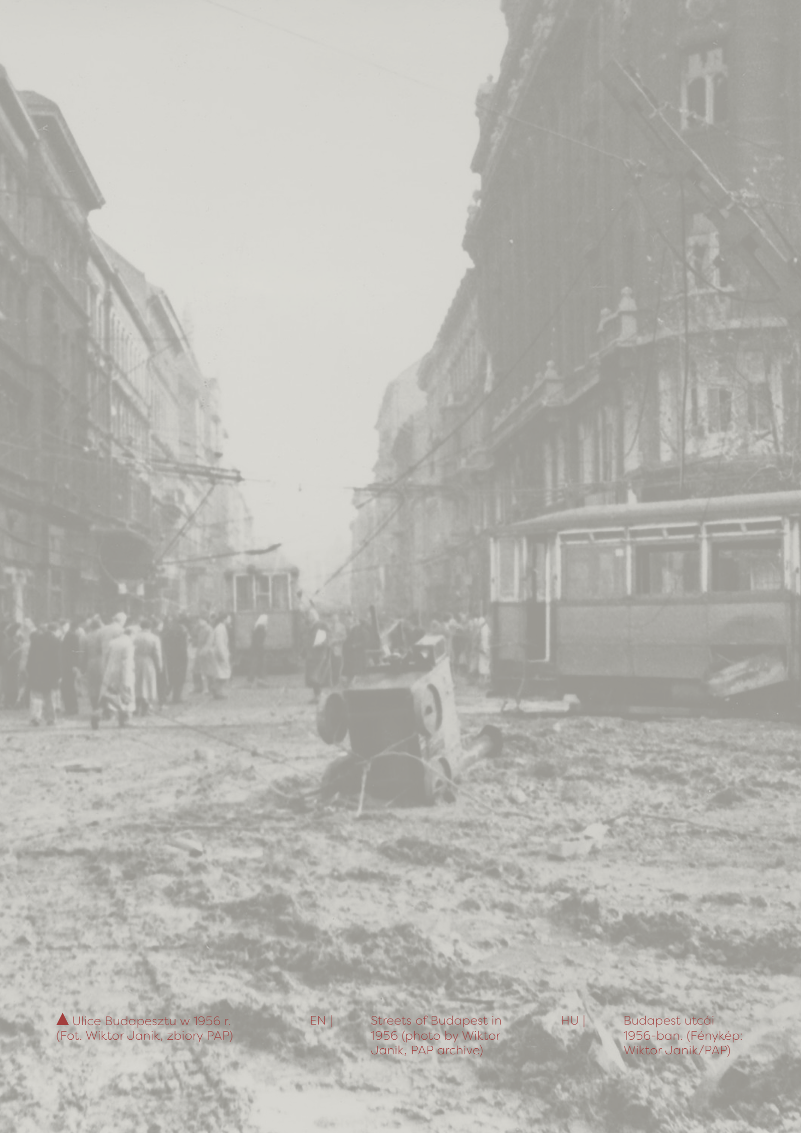
▲ Ulice Budapesztu w 1956 r.