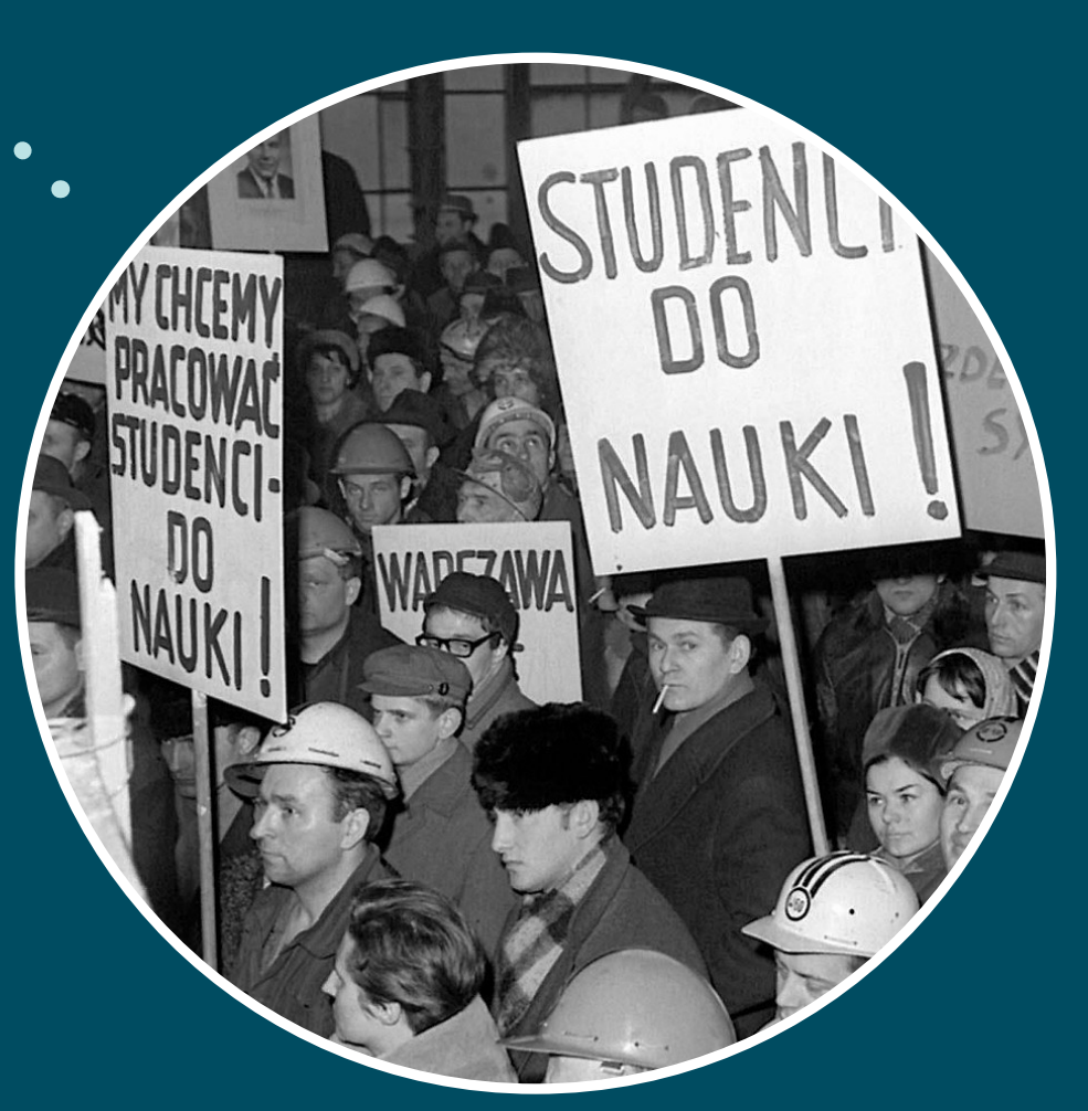
OFICJALNE, „SPONTANICZNE” WIECE W ZAKŁADACH PRACY POTĘPIAJĄCE M.IN. PROTESTUJĄCYCH STUDENTÓW