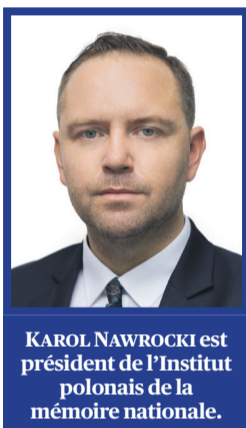
KAROL NAWROCKI est président de l'Institut polonais de la mémoire nationale.