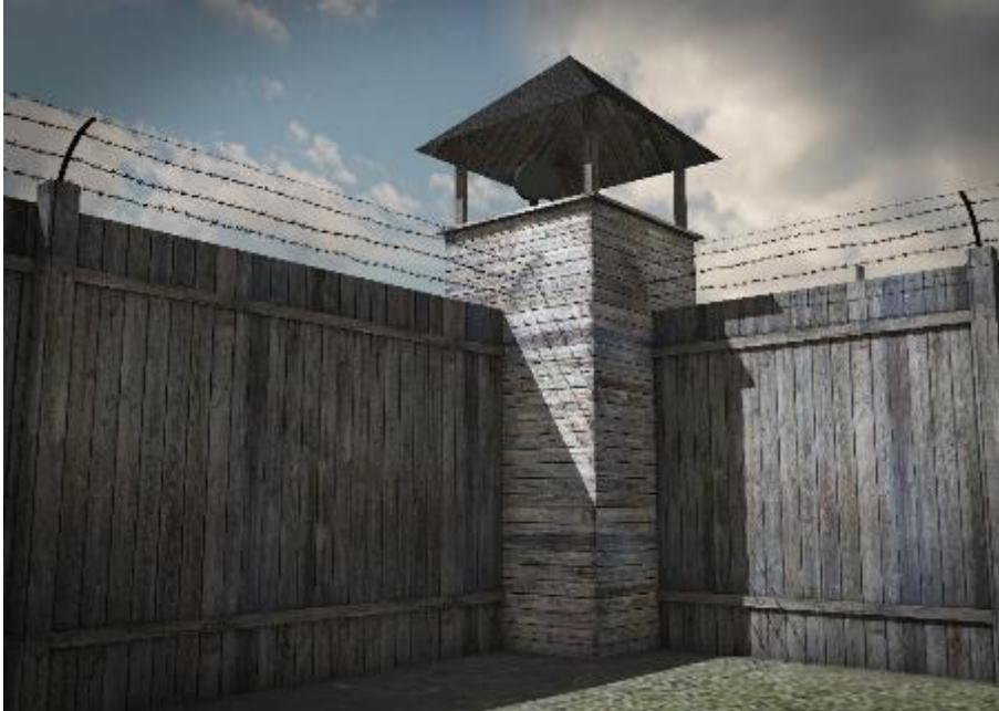
Reconstruction de tour de garde avec clôture (point « W ») (Carte interactive du camp de travail allemand pour les enfants polonais situé rue Przemysłowa à Łódź (Archives de l'IPN - Agence de Łódź).

De trois cotés on a érigé une clôture de trois mètres de hauteur, construite de planches parfaitement contiguës les unes aux autres, et surmontée de barbelés. Du côté du cimetière juif adjacent au camp, un mur en briques rehaussé jusqu'à la hauteur de la clôture en bois formait un obstacle. Le portail principal se trouvait à la sortie de la rue Przemysłowa qui avant la guerre aboutissait seulement à la rue Bracka, mais elle ne la croisait pas. Pour les besoins du camp, la rue Przemysłowa a été prolongée et transformée en Lager Straße , c'est à dire une allée principale du camp pavée par les enfants de gravats et de scories. En cet endroit il y avait des appels et ici on imposait des sanctions aux prisonniers. Cette allée menait dans la direction de la rue Górnicza où se trouvait un plus petit portail pour les ouvriers juifs, véhicules de livraison d'approvisionnement et fourgons par lesquels on transportait des enfants malades ou leurs corps au cimetière catholique de Saint Wojciech situé 81 rue Kurczaki. Troisième portail extérieur était situé du côté de la rue Bracka et il a été tracé sur l'axe de la rue actuelle de Tadeusz Mostowski ( Roderich Straße ). Juste à côté on a créé un poste de garde. Ici, depuis 1944, on amenait les enfants voir leur parents. A l'intérieur du camp il y avait encore un autre portail par lequel on pouvait passer du camp principal au sous-camp pour les filles.