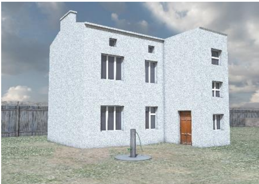
Reconstruction du bâtiment de l'atelier d'aiguilles (point « 49 ») (Carte multimédia du camp de travail allemand pour les enfants polonais dans la rue Przemysłowa à Łódź (Archives de

Le camp faisait surtout fonction d'un « grand atelier de travail », pour cette raison le devoir primordial des détenus c'était de porter de l'aide à l'économie allemande et à l'armée. Les garçons étaient le plus souvent affectés au travail dans l'atelier d'aiguilles où ils redressaient des aiguilles à tisser. Dans « l'atelier de savates » ils tressaient de la paille pour en faire des chaussures d'hiver difformes pour les soldats allemands qui combattaient en Union soviétique. En plus, ils faisaient des nattes en osier qu'on utilisait comme support de protection qu'on mettait au-dessous des roues de véhicules militaires quand elles s'enfonçaient dans la boue ou la neige. Les garçons recousaient aussi des havresacs et des sacs à dos déchirés et réparaient des chaussures militaires. Dans l'atelier de couture on préparait des éléments pour les uniformes et confectionnait des vêtements de travail pour les prisonniers. Ces travaux étaient faits par les garçons et les filles qui en plus reparaient des trous de balles ou déchirures des uniformes. Certaines filles fabriquaient aussi des fleurs artificielles en papier, tricotaient des bonnets, gants et écharpes, crochetaient et brodaient des nappes. Dès le printemps 1943, les plus fortes d'entre elles sont envoyées dans une exploitation agricole de 160 hectares à Dzierżazna, où elles travaillent aux champs, s'occupent des animaux de ferme et capturent des poissons dans l'étang.