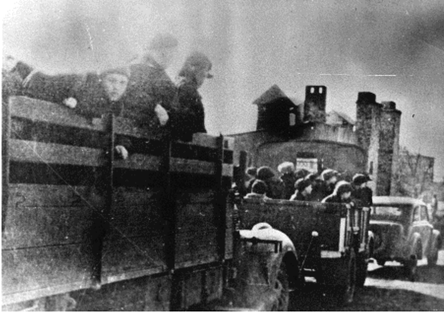
Transport des prisonniers de la Gare Łódź-Kaliska au camp

Les Allemands ont envisagé que le camp compterait deux mille prisonniers à la fois, mais les effectifs étaient beaucoup plus nombreux jusqu'à l'été 1944 quand on a enregistré environ mille deux cents détenus. Il faut en soustraire plus d'une centaine de filles qui dès le printemps 1943 ont été dirigées à une succursale agricole à Dzierżazna près de Zgierz. Ainsi les autorités allemandes ont saisi une opportunité de rendre le camp indépendant de l'approvisionnement alimentaire de l'extérieur. À partir de la moitié de 1944 on libère de plus en plus d'enfants. Une partie d'entre eux ont été délivrés grâce à leurs parents qui ont signé le volksliste, d'autres ont été envoyés au travail dans les usines de Łódź ou aux entreprises allemandes à l'intérieur du Reich.