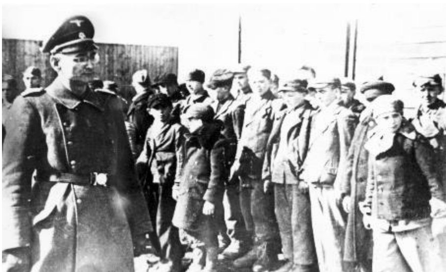
Visite du camp par le chef de la police criminelle allemande.