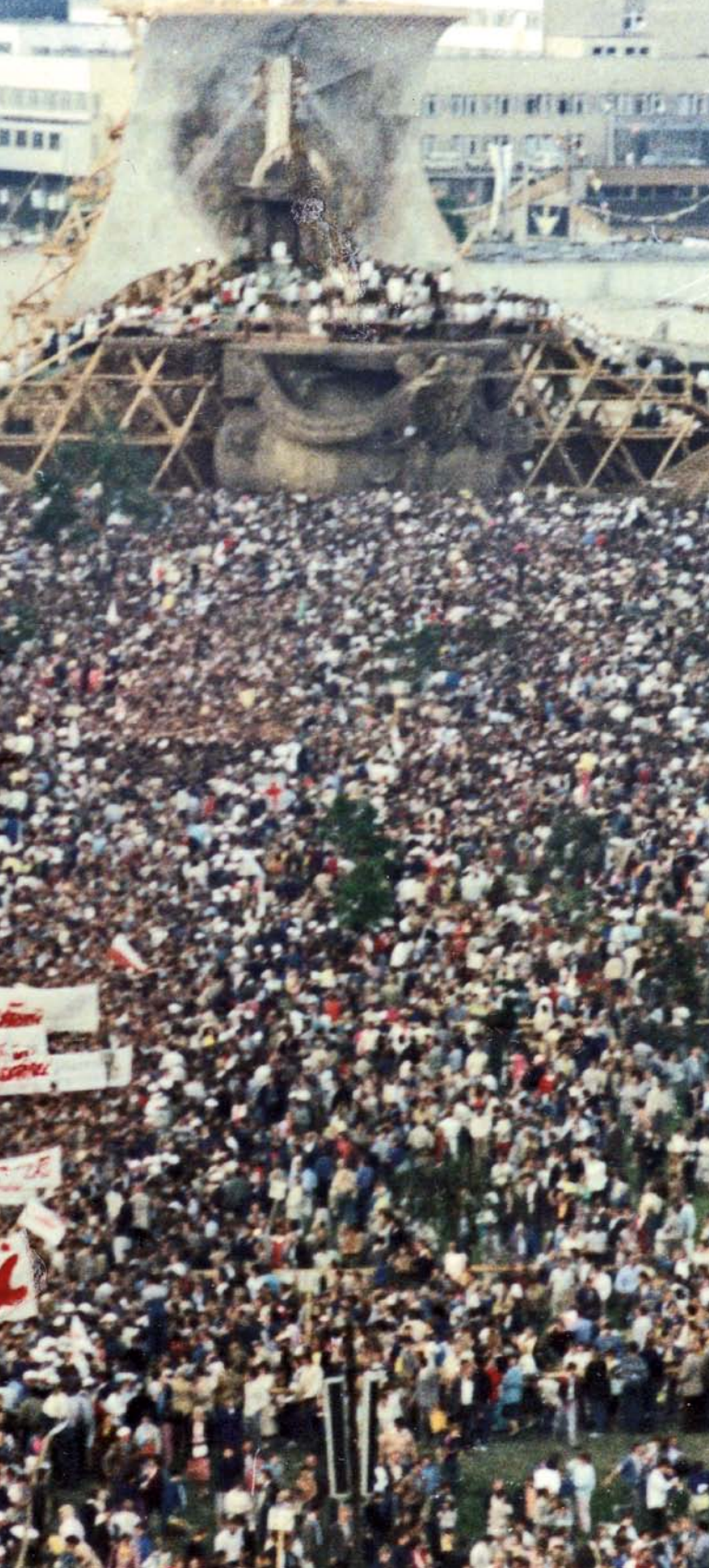
Msza św. na Zaspie w Gdańsku z udziałem Jana Pawła II podczas jego trzeciej pielgrzymki do Polski. Wśród wiernych widoczne są liczne flagi i transparenty z napisem „Solidarność”, 8 czerwca 1987 r.