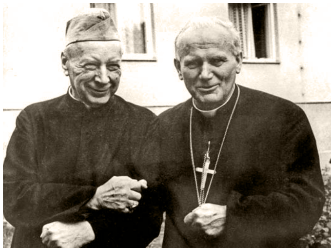
Prymas Stefan Wyszyński i kardynał Karol Wojtyła, Fiszor, sierpień 1978 r.