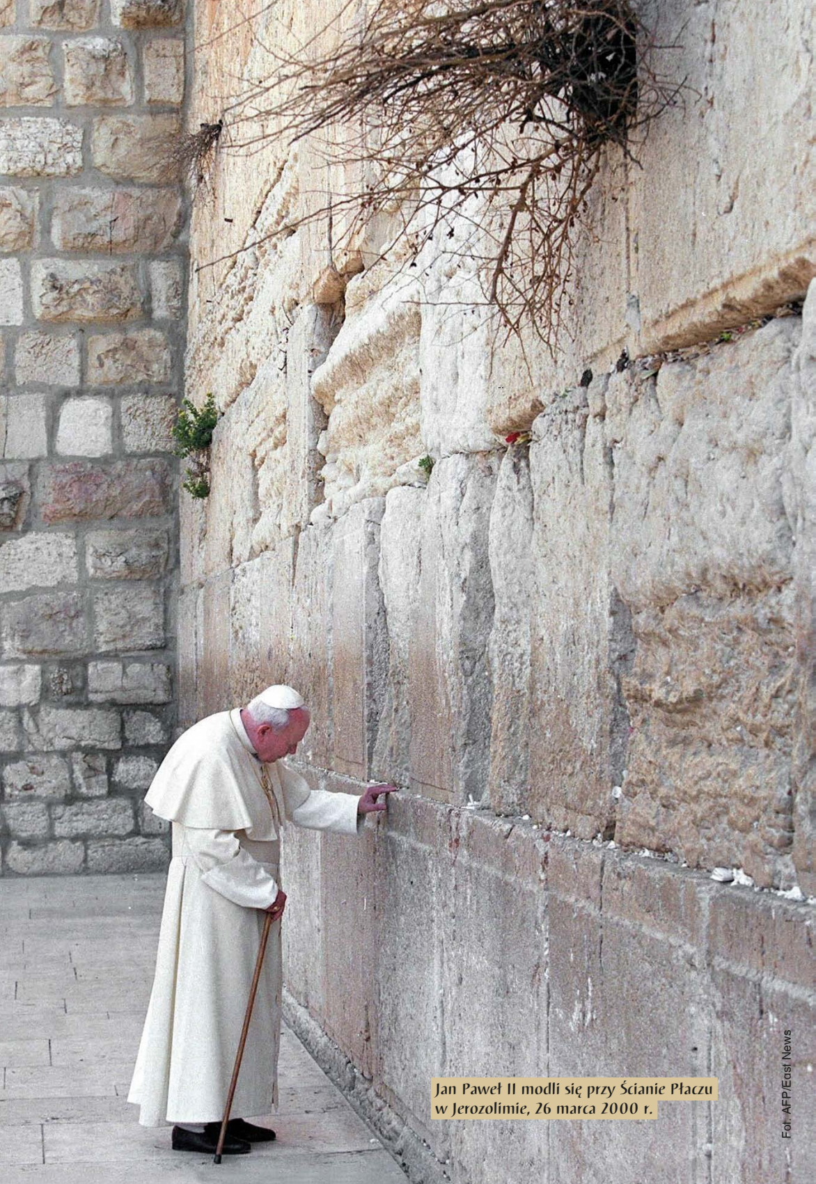
Jan Paweł II modli się przy Ścianie Płaczu w Jerozolimie, 26 marca 2000 r.