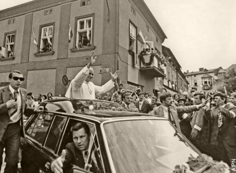
Jan Paweł II podczas pierwszej pielgrzymki do Polski wjeżdża na rynek swego rodzinnego miasta, Wadowice, 7 czerwca 1979 r.