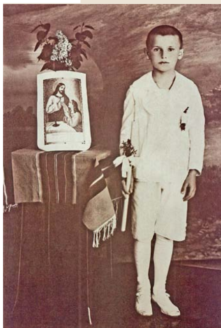
Karol Wojtyła w dniu Pierwszej Komunii Świętej, Wadowice, maj 1929 r.