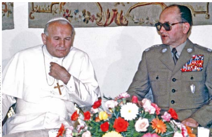
Spotkanie Jana Pawła II z gen. Wojciechem Jaruzelskim, Warszawa, 17 czerwca 1983 r.