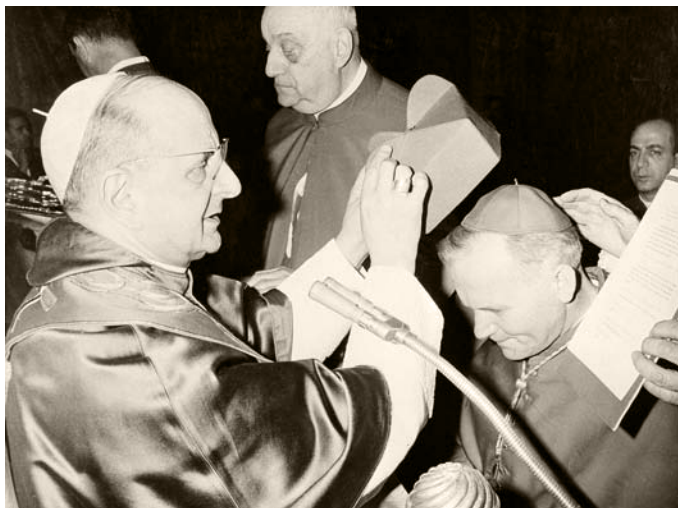
Arcybiskup metropolita krakowski Karol Wojtyła otrzymuje z rąk papieża Pawła VI kapelusz kardynalski, Watykan, 28 czerwca 1967 r.