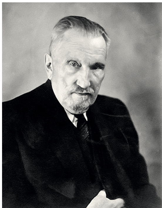
■ ANDRIJ LIWYCKI.

jego organizacji, ale samego Borowca nie zdołało dopaść.