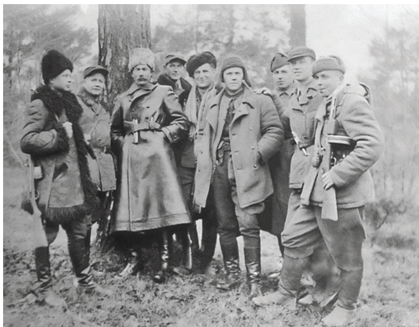
■ BULBOWCY, 1942 R.

Po ataku Niemiec na Związek Sowiecki zaczęła się także wielka kariera Bulby-Borowca. Na czele małej grupy partyzantów rozbroił sowiecką milicję w Sarnach i przejął kontrolę nad miastem. Po nadejściu Niemców otrzymał od nich zgodę na utworzenie liczącej tysiąc ludzi Siczy Poleskiej (historyczna nazwa „sicz” oznacza obóz warowny), której zadaniem było oczyszczenie bagien Polesia z rozbitków Armii Czerwonej. W końcu sierpnia opanował miasto Olewsk i przeniósł się tam ze swoim sztabem. Przez trzy miesiące Olewsk był stolicą ukraińskiego państewka rozciągającego się aż do Pińska. W swoich odezwach do ludności Borowec odwoływał się do tradycji Ukraińskiej Republiki Ludowej i kozaczyzny. Swoje przywiązanie do obyczajów podkreślał kozackim strojem z szablą u boku. Choć przedstawiciele ukraińskiej inteligencji uważali taką maskaradę za komiczną,