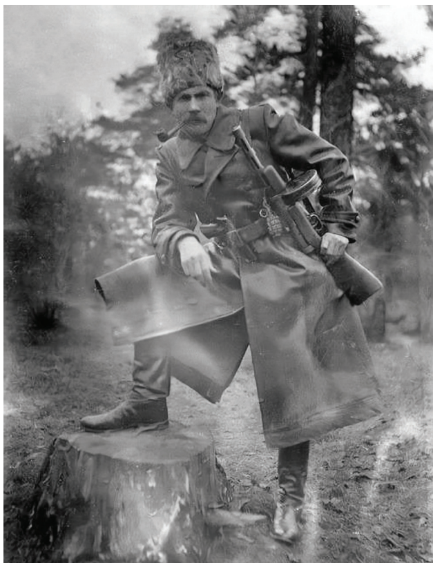
■ TARAS BULBA-BOROWEC.

rowcy zaczęli się posługiwać nazwą Ukraińska Armia Powstańcza. Celowo ukradli bulbowcom nazwę „UPA” dla swoich oddziałów zbrojnych, gdyż doskonale zdawali sobie sprawę, że była ona dobrze rozpoznawalna na Wołyniu i Polesiu, a zatem najlepsza pod względem propagandowym. Początkowo banderowska UPA podszywała się pod oddziały partyzantki bulbowskiej, w celu zdobycia zaufania miejscowej ludności ukraińskiej. Prawdopodobnie z tej przyczyny wzięły się fałszywe oskarżenia pod adresem bulbowców o udział w eksterminacji ludności polskiej na Wołyniu. Polacy bowiem, podobnie jak sowieccy partyzanci, bardzo