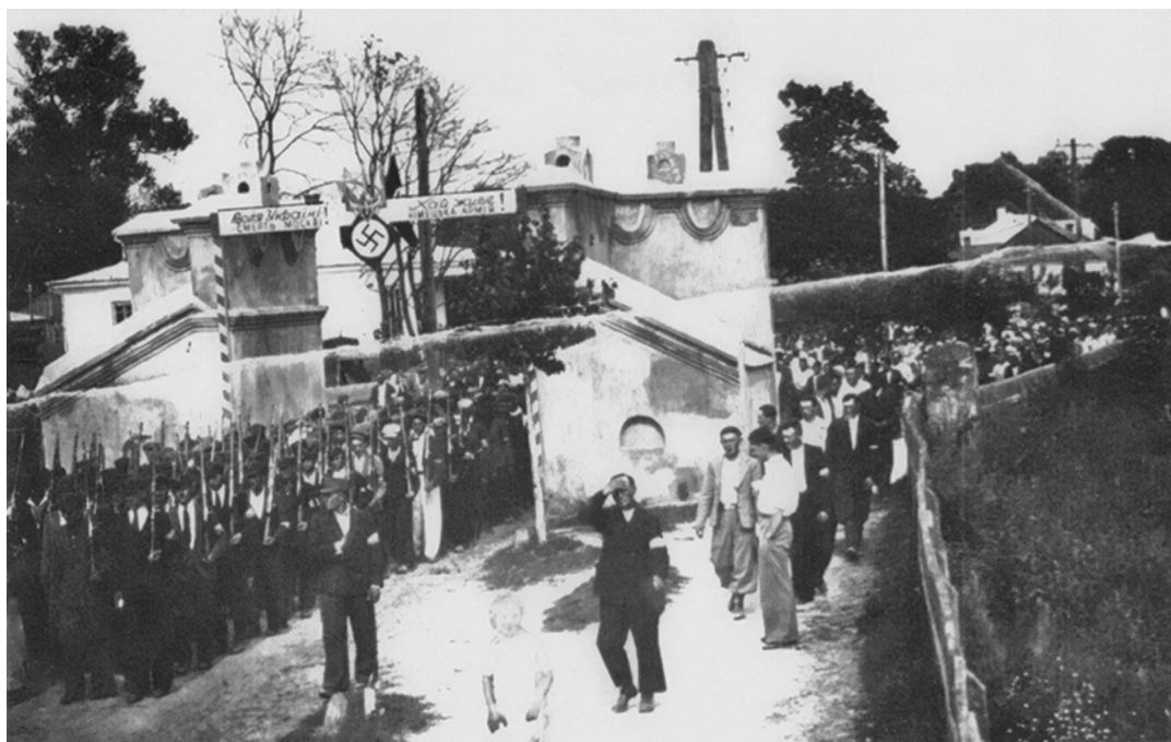
■ TWORZENIE ODDZIAŁÓW UPA TARASA BULBY-BOROWCA, BEREZNE, POW. KOSTOPOLSKI, LIPIEC 1941 R.

obozu oddziały dla więźniów specjalnych RSHA, Zellenbau. Miał do dyspozycji dwupokojową celę – pokój gościnny i sypialnię – urządzonej jak normalne mieszkanie. Posiłki spożywał w jadalni SS, nie musiał nosić stroju obozowego i nie był zmuszany do pracy. Pozwalało mu na kontakt z żoną i ze światem zewnętrznym. Banderowcy kontynuowali bez Bandery zaplanowaną przez niego „ukraińską rewolucję narodową”, stosując masową przemoc wobec wrogów narodu. Uciekali się nawet do mordowania działaczy konkurencyjnej frakcji melnykowców (OUN-M).