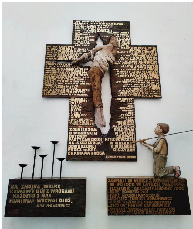
■ TABLICA W BAZYLICE MARIACKIEJ W GDAŃSKU POŚWIĘCONA PAMIĘCI ŻOŁNIERZY 3 WILEŃSKIEJ BRYGADY AK.

naszych sojuszników” przed faktem dokonany – ostatnią wielką próbą zachowania polskości tych ziem.