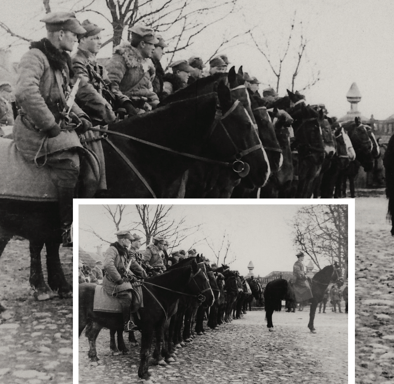
■ KAWALERIA 3 WILEŃSKIEJ BRYGADY ARMII KRAJOWEJ NA PL. TURGIELACH.

został zatrzymany przez NKWD i kolejne dni spędził w więzieniu, ale i tym razem zdołał zbiec. 3 listopada 1939 r. ponownie znalazł się na wolności.