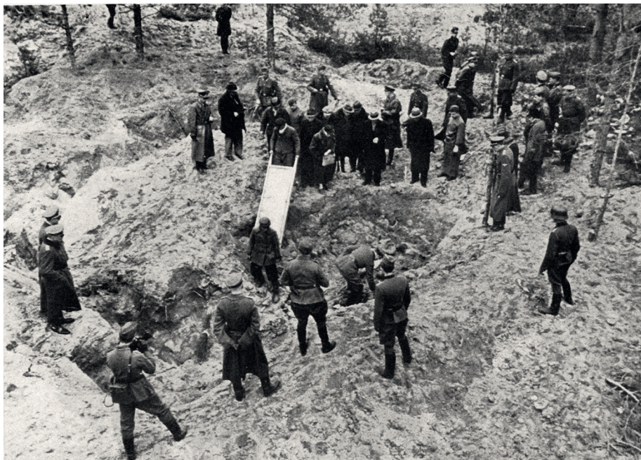
■ EKSHUMACJA ZWŁOK Z JEDNEGO ZE ZBIOROWYCH GROBÓW POLSKICH OFIAR W LESIE KATYŃSKIM, KWIECIEŃ 1943 R.

czym uchronić mogłaby tylko armia niemiecka. Efektem miało być zmobilizowanie Europejczyków do wspierania jej działań wojennych na froncie wschodnim lub przynajmniej niesabotowania wysiłku zbrojnego Niemiec. W nieco innym celu, chciano też wpłynąć na opinię społeczeństw anglosaskich – pokazanie im okrucieństwa bolszewików miało zasiać wątpliwość, co do zasadności pro-