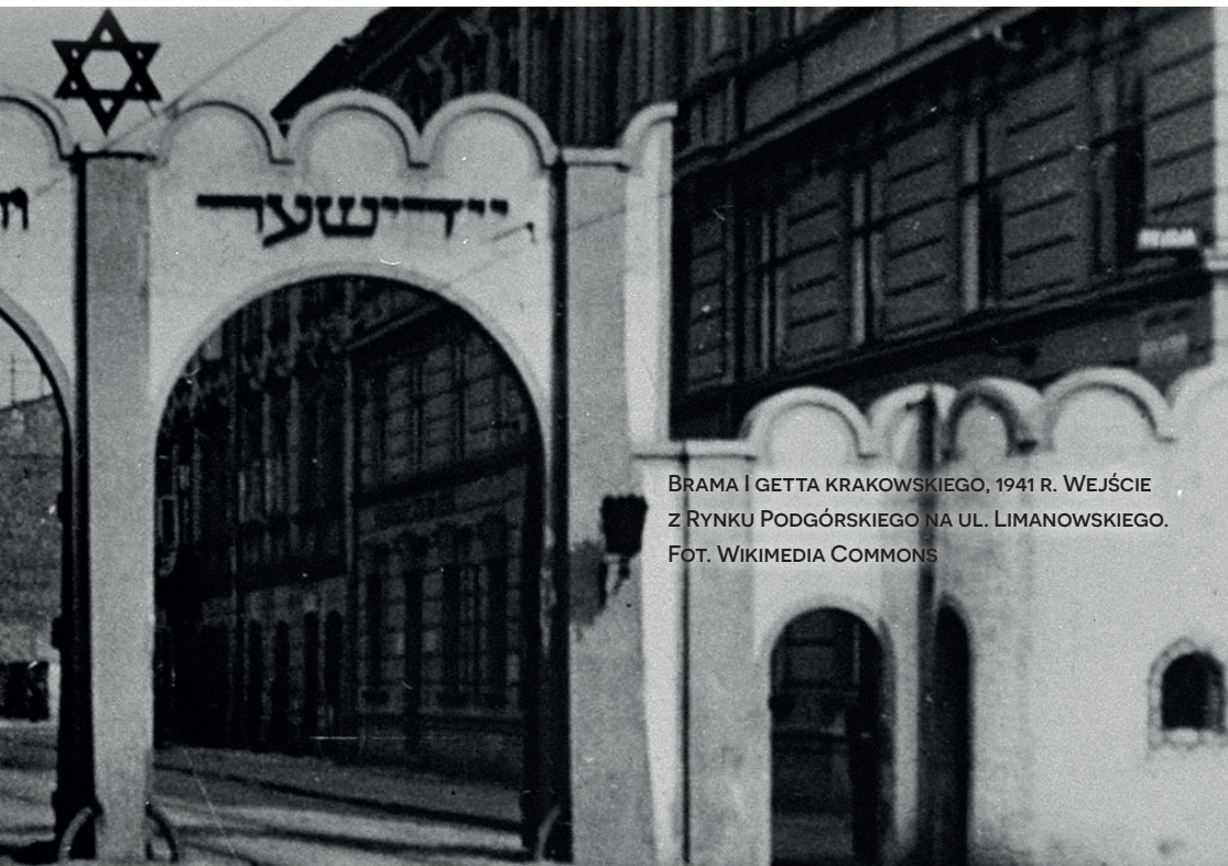
BRAMA I GETTA KRAKOWSKIEGO, 1941 R. WEJŚCIE Z RYNKU PODGÓRSKIEGO NA UL. LIMANOWSKIEGO.