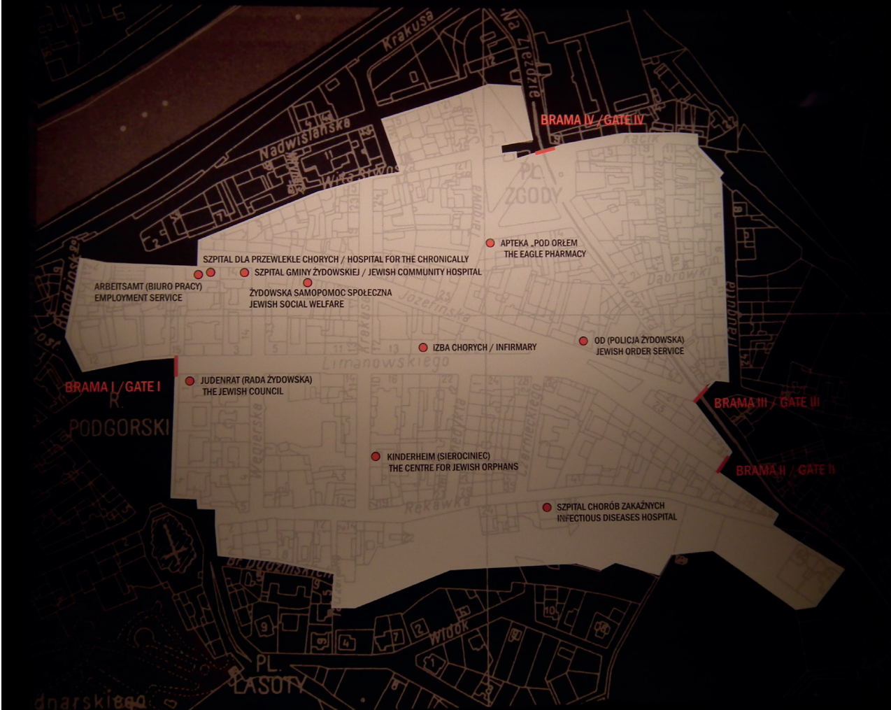
■ PLAN GETTA W KRAKOWIE.

miejsce. Wychowywaliśmy go jak syna przez miesiąc a może dłużej [...]” 9 . Najprawdopodobniej ze względu na zagrożenie, mały uciekinier z getta został przeniesiony do domu Michała i Anny Wierzbickich. Po latach ich córka Wanda relacjonowała: „Mama przyprowadziła małego, drobnego chłopca. »Będzie u nas mieszkał« – powiedziała – »ale nikt nie może się o tym dowiedzieć«. To był Janek Weber” 10 . Chłopiec mieszkał u Wierzbickich w pokoju zamkniętym na klucz. Po latach pisał, że był pouczony przez swoich opiekunów, żeby nie robić hałasu i nie podchodzić do okien. Jedzenie przynoszono mu zazwyczaj w nocy.