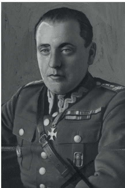
Płk Stanisław Maczek, dowódca 81. pp w Grodnie, 1931–1933.

U rodził się 31 marca 1892 r. w małym miasteczku Szczerec, ok. 30 km na południe od Lwowa, ale wychowywał się w Drohobyczu. Z trzema braćmi, którzy zginęli później na wojnach (dwóch w szeregach armii austriackiej, jeden już jako podporucznik WP w 1920 r.), uczęszczał tam do gimnazjum, działał w harcerstwie. Były to lata szczęśliwe, „wiew dzieciństwa, lat gimnazjalnych, beztroskich wakacji letnich” – jak wspominał późniejszy generał 1 . W 1910 r. zdał egzamin dojrzałości. Po wakacjach rozpoczął studia w Szkole Politechnicznej we Lwowie, ale po ukończeniu jednego semestru przeniósł się na Wydział Filozofii i Filologii Polskiej na Uniwersytecie Lwowskim. Równolegle pracował w akademickim stowarzyszeniu „Życie”, a od roku 1912 działał w Związku Strzeleckim we Lwowie.