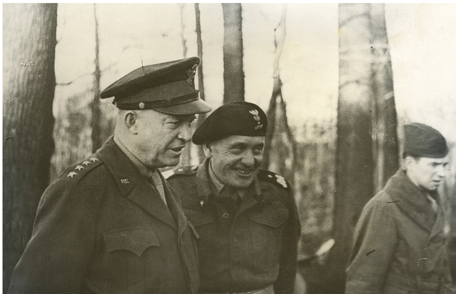
Gen. Dwight Eisenhower i gen. Stanisław Maczek podczas inspekcji oddziałów polskich w Holandii, listopad 1944 r.

z uwagi na zarys warstwic na mapie, ponieważ północna część wzgórza przypominała głowicę, a południowa rękojeść maczugi. Generał Maczek wydał rozkaz zajęcia wzgórza i utrzymania go za wszelką cenę, słusznie przewidując, że tamtędy przebiegać będzie droga odwrotu 7. Armii. Polacy przez dwa dni i dwie noce bili się bez przerwy, odpierając fanatyczne ataki wroga próbującego wydostać się z kotła, a z drugiej strony – z niemieckimi oddziałami, które chciały to umożliwić. Czołgi nieprzyjacielskie podchodziły niekiedy na odległość kilkunastu metrów – i były niszczone. Wokół polskich pozycji piętrzyły się ciała Niemców. Dochodziło do walk wręcz. Wstrząsającym przykładem zawziętości obu walczących stron były wraki czołgów Panther i Sherman stojących naprzeciw siebie, lufa w lufę, zniszczonych jednoczesnymi strzałami z odległości kilku metrów.