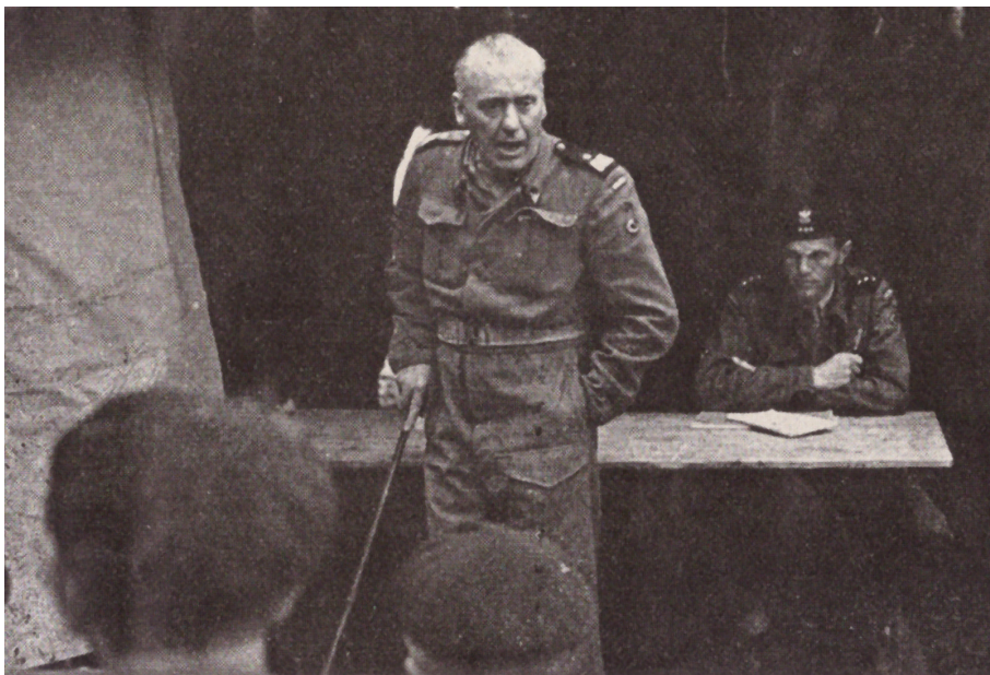
Gen. Stanisław Maczek podczas odprawy, sierpień 1944 r.

Rankiem 19 września płk Maczek na czele stopniałej do 1,5 tys. żołnierzy 10. Brygady Kawalerii (z 3 tys. rozpoczynających wojnę 1 września), ze sztandarami, z pełnym uzbrojeniem i kilkoma sprawnymi tankietkami, przejechał przez Przełęcz Tatarską granicę państwa. Do Polski nigdy już nie wrócił.