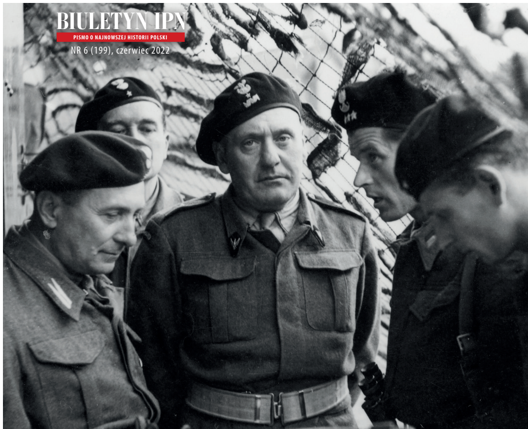
Gen. Stanisław Maczek z oficerami 1. DPanc podczas odprawy, 14 lipca 1944 r.