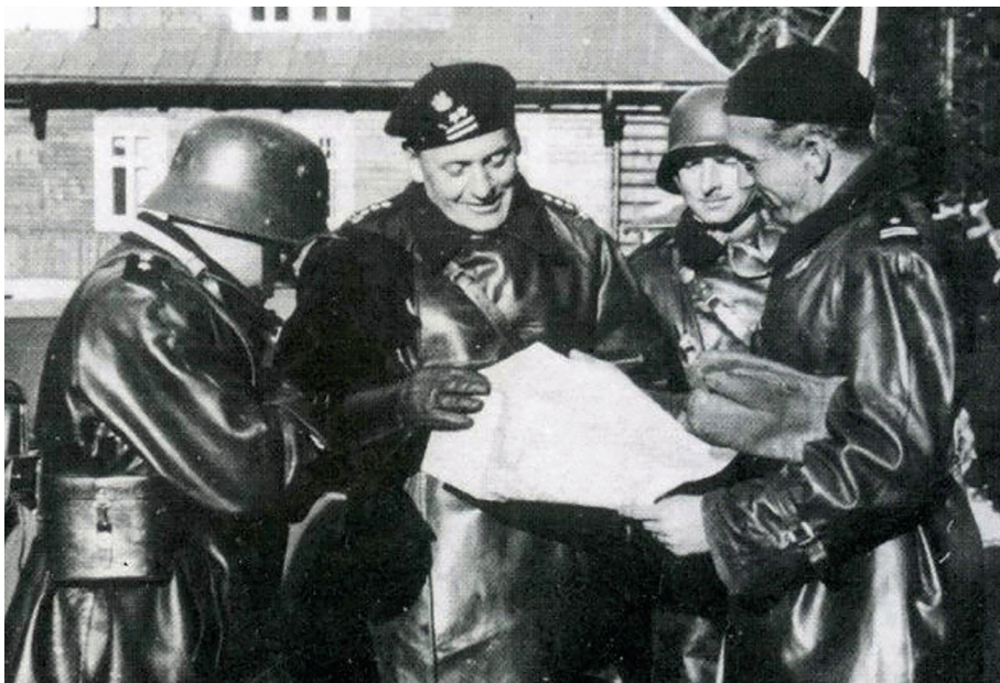
Plk Stanisław Maczek wśród żołnierzy 10. Brygady Kawalerii, 1938 r.

skład wchodziły m.in.: dowództwo, dywizjon przeciwpancerny, dywizjon rozpoznawczy i dwa pułki kawalerii będące w zasadzie zmotoryzowanymi batalionami piechoty – 24. Pułk Ułanów z Kraśnika i 10. Pułk Strzelców Konnych z Łańcuta. Już w okresie mobilizacji dowództwu brygady podporządkowano jeszcze m.in. dywizjon artylerii motorowej, zmotoryzowany batalion saperów, kompanię czołgów rozpoznawczych (13 wozów TKS) i kompanię czołgów lekkich Vickers (16 wozów). Przewidzianego nowym etatem dwukompanijnego batalionu pancernego w sile 32 czołgów lekkich 7 TP nie udało się zrealizować przed wybuchem wojny.