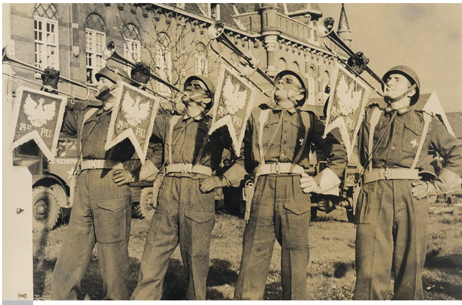
Żołnierze 1. DPanc w wyzwolonej Bredzie, jesień 1944 r.