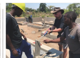
Renovation works at the Rusape cemetery in 2019