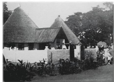
Polski kościół w Rusape, lata 40. XX w.