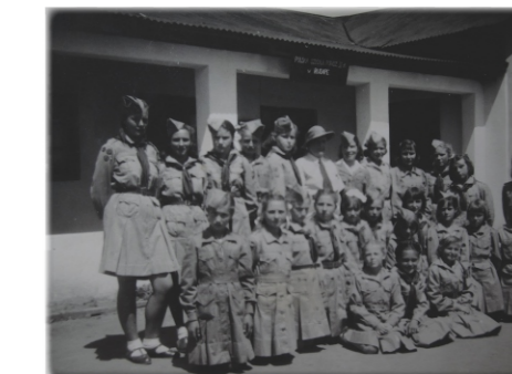
Scouts in front of the Third Degree Primary School in Rusape, 1940s