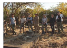
Oczyszczanie polskiego cmentarza w Rusape w 2018 r.