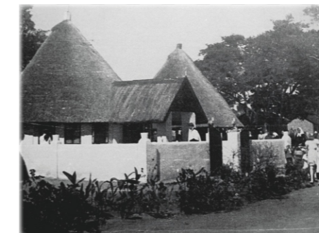
Polish church in Rusape, 1940s