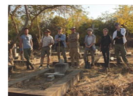
Clearing the Polish cemetery in Rusape in 2018