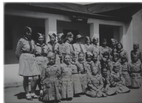
Harcerki przed Szkołą Powszechną III Stopnia w Rusape, lata 40. XX w.