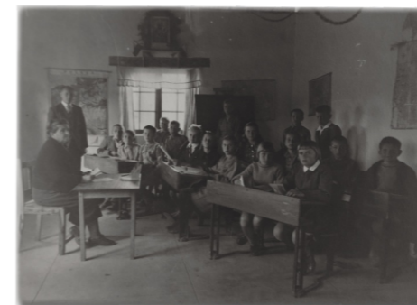
Polish school in Rusape, 1945