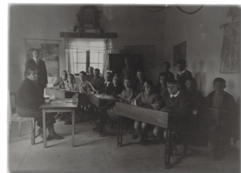
Polska szkoła w Rusape, 1945 r.