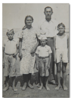
Rodzina Świców na plaży w Pahlevi (Iran) po ewakuacji z ZSRS.