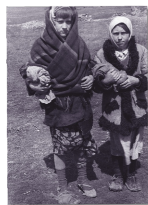
Polskie dzieci na zesłaniu w Kazachskiej SRS.