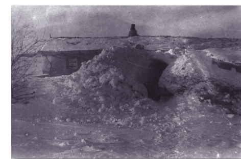
Zabudowania mieszkalne przeznaczone dla polskich obywateli deportowanych na tereny Kazachskiej SRS.

W Afryce założono kilka ośrodków, skupiających polskie władze oraz ok. 20 osiedli dla polskiej ludności, z których największymi były: Tengeru w Tanzanii (ówczesna Tanganika) oraz Masindi i Koja w Ugandzie. Po tragedii życia w Rosji Sowieckiej, w Afryce życie polskich uchodźców powoli wracało do normalności. Rozwijało się polskie szkolnictwo (w 1945 r. w 47 szkołach różnego stopnia uczyło się ponad 7 500 dzieci) i prężnie działało harcerstwo (w 1945 r. w 82 drużynach i 61 gromadach zachowawczych zrzeszonych było ok. 4 000 skautów). Dzieci odzyskiwały utracone dzieciństwo. Rozwijało się życie religijne i kulturalne (organizowano przedstawienia teatralne, działały chóry i orkiestry, uroczystości obchodzono polskie święta narodowe i religijne). Stosunki Polaków z miejscową ludnością były przyjazne. Po przeżyciach na zesłaniu, Afryka stała się dla ludności polskiej „rajem”, miejscem, gdzie bezpiecznie mogła przeczekać wojnę.