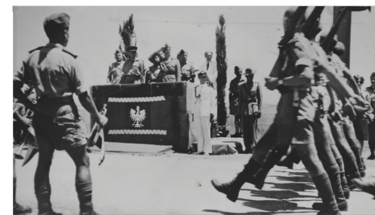
Parade during the visit of Prime Minister and Commander-in-Chief Gen. Władysław Sikorski, Qastina, Palestine, June 28, 1943.