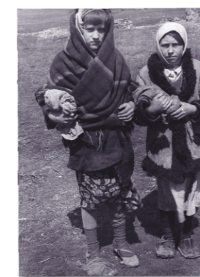
Polish children in exile in the Kazakh SSR.