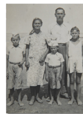
The Świców family on the beach in Pahlevi (Iran) after evacuation from the USSR.