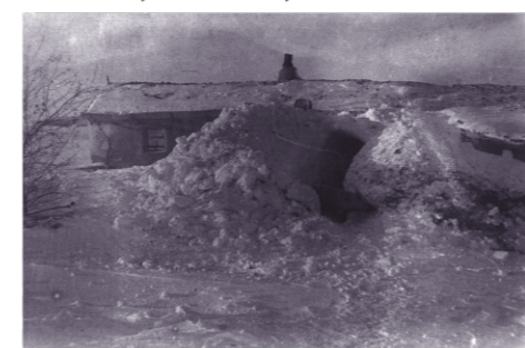
Residential housing intended for Polish citizens deported to the territory of the Kazakh SSR.

In Africa, several centres were established for Polish authorities, as well as about 20 settlements for the Polish population, with the largest in Tengeru in Tanzania (then Tanganyika) and Masindi and Koja in Uganda. After the tragedy of life in Soviet Russia, in Africa the lives of Polish refugees slowly returned to normal. Polish education developed (in 1945, over 7,500 children studied in 47 schools of various levels) and scouting was active (in 1945, there were about 4,000 scouts in 82 troops and 61 packs). Children regained their lost childhood. Religious and cultural life flourished (theatre performances were organized, choirs and orchestras operated, Polish national and religious holidays were solemnly celebrated). The relations between Poles and the local population were friendly. After the experiences in exile, Africa became a paradise for the Polish people, a place where they could safely wait out the war.