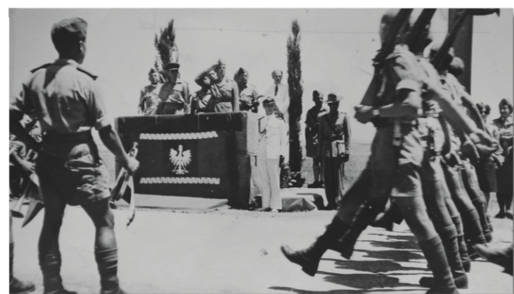
Defilada podczas wizyty premiera i naczelnego wodza gen. Władysława Sikorskiego w Qastynie, Palestyna 28.06.1943 r.