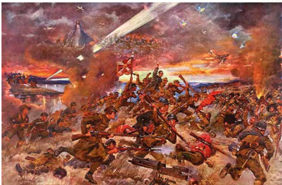
Jerzy Kossak Cud nad Wisłą, Bitwa Warszawska (Muzeum Zamku Królewskiego w Warszawie)

że w wizji malarza obecne są również elementy nadnaturalne, w tym Matka Boska wysyłająca husarię na pole walki. Był to już rezultat nowej interpretacji zwycięstwa roku 1920, przedstawianego – zwłaszcza przez niechętnych Józefowi Piłsudskiemu endeckich publicystów – jako nie tyle sukces militarny, ile efekt boskiej interwencji („cud nad Wisłą”). Ksiądz Skorupka znakomicie nadawał się do wpisania w tę narrację. Pomagała w niej także wersja wydarzeń, według której kapelan miał zginąć, udzielając ostatniego namaszczenia innemu ciężko rannemu żołnierzowi.