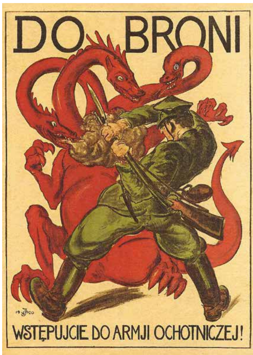
Plakat z 1920 r. nawołujący do wstąpienia do wojska (domena publiczna)

W decydującą fazę wkraczał wówczas konflikt zbrojny pomiędzy odradzającą się Rzeczpospolitą a bolszewicką Rosją, w którym Polacy bronili swojej niepodległości, bolszewicy zaś dążyli do przeniesienia – jak głosili: „po trupie Polski” – rządów rewolucyjnych na Zachód.