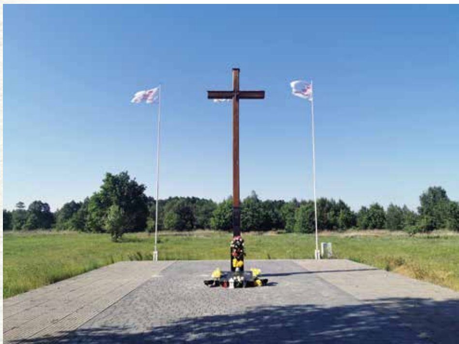
Krzyż w Ossowie upamiętniający miejsce śmierci ks. Skorupki, 2020 r.

który jako nuncjusz apostolski przebywał w 1920 r. w Warszawie. Freski poświęcone księdzu na polecenie papieża znalazły się w Sanktuarium Santa Casa w Loreto oraz w Castel Gandolfo.