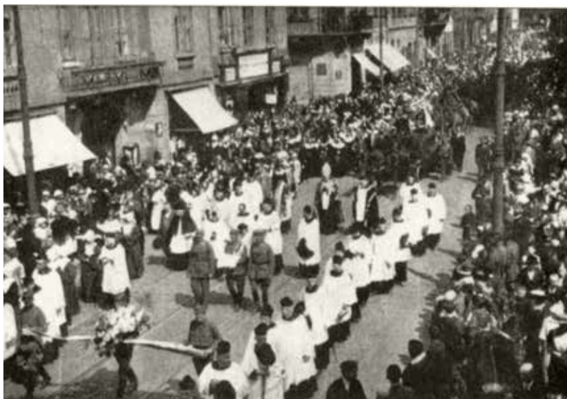
Pogrzeb ks. Ignacego Skorupki (domena publiczna)

Choć walki z bolszewikami miały trwać jeszcze wiele dni (np. 18 sierpnia Armia Czerwona zaatakowała Płock), stolica i niepodległość Rzeczypospolitej zostały uratowane.