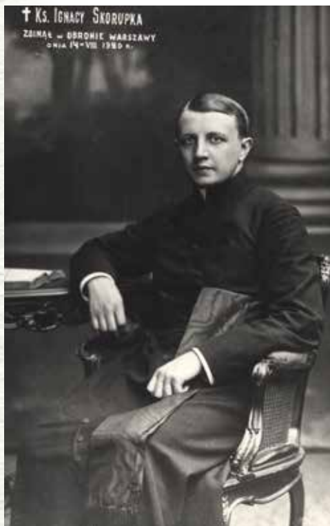
Ksiądz Ignacy Skorupka

który do spełnienia podniosłej ofiary przygotował się życiem bez skazy i udoskonaleniem najwyższym pięknej z przyrodzenia duszy, drudzy widzieli w nim entuzjastę, który spełnił czyn wzniosły, ulegając fanatycznej egzaltacji, która kazała mu zamknąć oczy na wszelkie niebezpieczeństwa”. Tak trafnie zarysowana sto lat temu różnica w ocenie decyzji i czynów księdza pozostaje aktualna i dzisiaj.