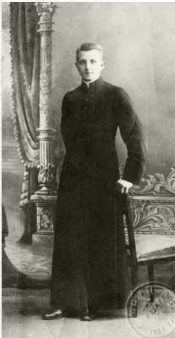
Ignacy Skorupka jako młody kleryk w Akademii Duchownej w Piotrogradzie, ok. 1914 r. (domena publiczna)