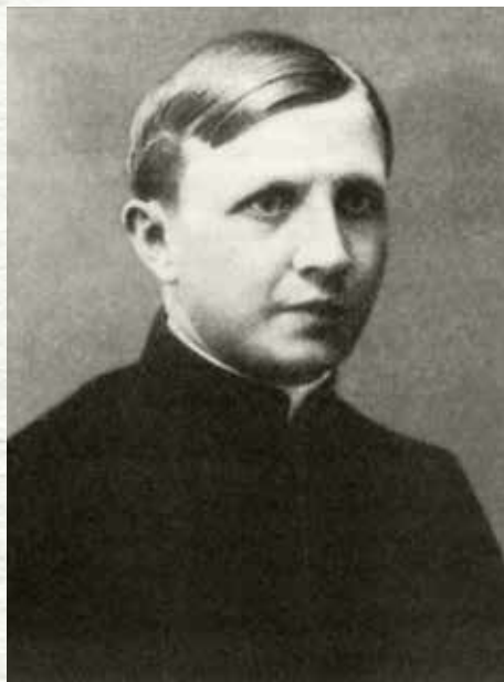
Ksiądz Ignacy Skorupka latem 1920 r. (domena publiczna)

dlatego, odrzekł, chcę iść do wojska” – wspominał po latach kardynał.