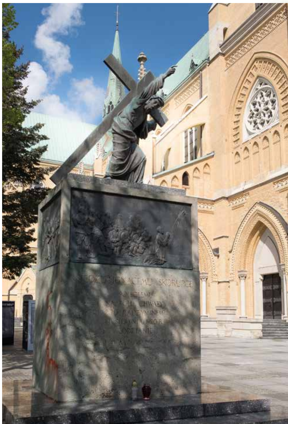
Pomnik ks. Ignacego Skorupki w Łodzi