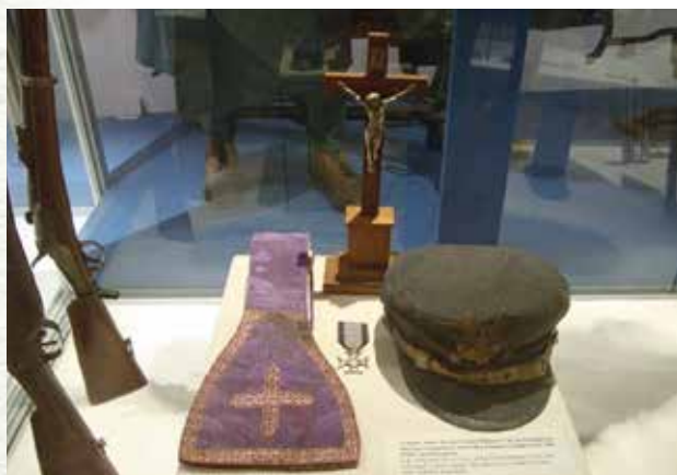
Pamiętki po ks. Skorupce w Muzeum Wojska Polskiego

Zwłoki ks. Skorupki pochowano w prostej żołnierskiej trumnie, w sutannie, w której zginął, z nałożonym ornatem (krzyż i stuła księdza trafiły do Muzeum Wojska Polskiego w Warszawie). Generał Haller udekorował wieko trumny Krzyżem Srebrnym Orderu Virtuti Militari, a poległego pożegnała salwa honorowa kompanii Wojska Polskiego. Ksiądz Ignacy Skorupka spoczął na cmentarzu na Powązkach.