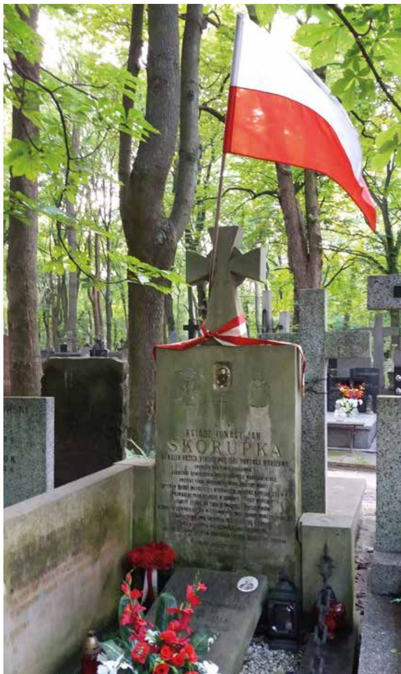
Grób rodziny Skorupków na warszawskich Powązkach, 2020 r.