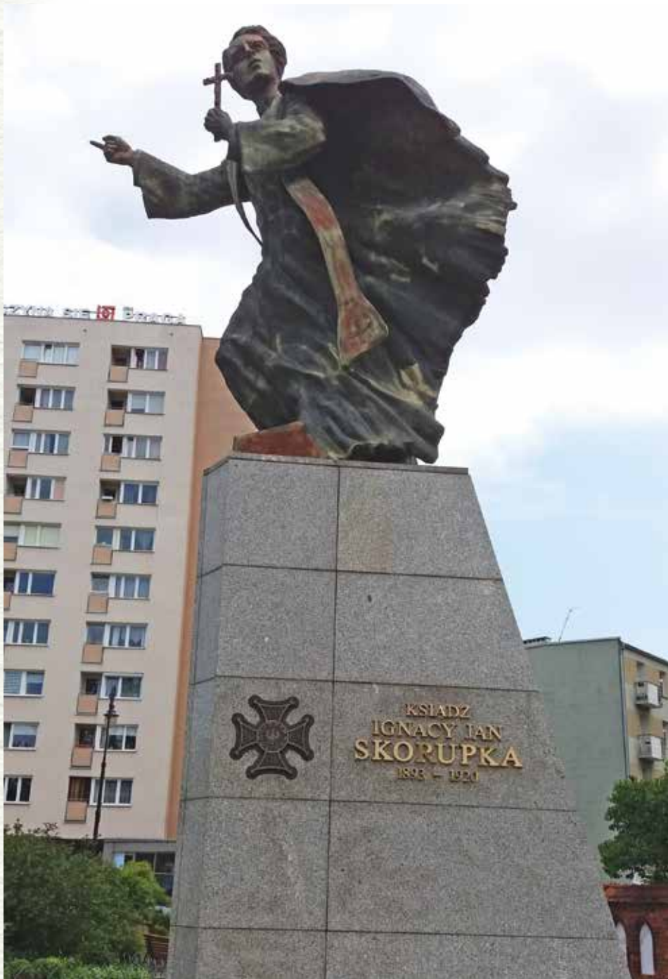
Pomnik ks. Ignacego Skorupki na warszawskiej Pradze