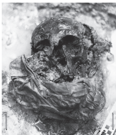
Szkielet z fragmentem materiału uwiązanym wokół szyi. Turza, 1990 r.