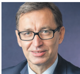
JAROSŁAW SZAREK PREZES INSTYTUTU PAMIĘCI NARODOWEJ

8 maja 1945 roku świat świętował zakończenie II wojny światowej – koniec niewyobraźnego piekła, rozpoczętego agresją Niemiec i Związku Sowieckiego na Polskę. Na ruinach zdobytego Berlina zwycięscy żołnierze sowieccy wieszali czerwone flagi z sierpem i młotem.