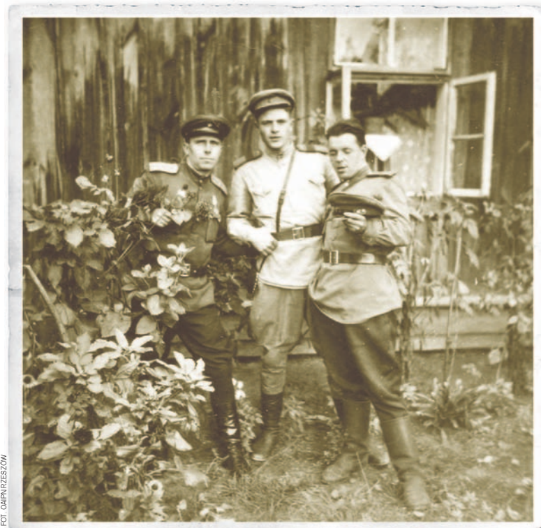
Żołnierze Armii Czerwonej na Rzeszowszczyźnie

W dramatycznej sytuacji znalazło się kilka milionów cywilnych Polaków, którzy po przejściu frontu pozostali w rodzinnych stronach, już pod władzą ZSRS. Terror policji politycznej, fatalne warunki życia i antypolskie działania w sferze politycznej i kulturalnej, wymuszały decyzje o wyjeździe. Zmiana granicy dokonała się nie z woli mieszkańców, ale bezwzględnością siły wojska. To Armia Czerwona była winna bezpośrednio krzywdy mieszkańców, którzy stali przed koniecznością ich opuszczenia lub pozostali jako mieszkańcy gorszej kategorii.