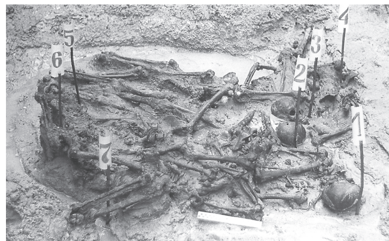
Zbiorowa mogiła odnaleziona podczas ekshumacji w Turzy, 1990 r.

Wywózki skazańców odbywały się tego samego dnia, wieczorem w całkowitych