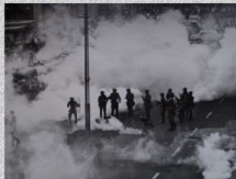
Koszalin - 31 sierpnia 1982 r. (Autor: Jerzy Patan)