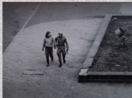
Koszalin - 31 sierpnia 1982 r. (Autor: Jerzy Patan)

Najszerzy zasięg miały wystąpienia 31 sierpnia 1982 r. w ponad 60 miastach. W Lubinie, Wrocławiu i Gdańsku zginęło 5 osób, a w całym kraju zatrzymano ponad 5 tys. demonstrantów. Kolejne manifestacje w listopadzie i grudniu 1982 r. oraz w roku następnym nie osiągnęły już takich rozmiarów.