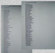
Listy internowanych w Działkowie i Wędrzychowie Polonimkim (fragmenty). (w zbiorach ZR NSZZ „S” Poznań)