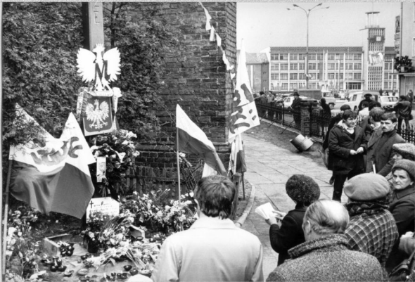
Warszawa - 1 maja 1982 r.