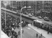
Szczecin - 1 maja 1982 r. (Wzbiornach ZR NSZZ „S” Pomorze Zachodnie)