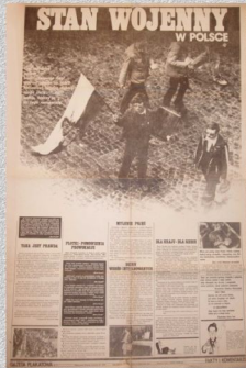
Plakat propagandowy PZPR