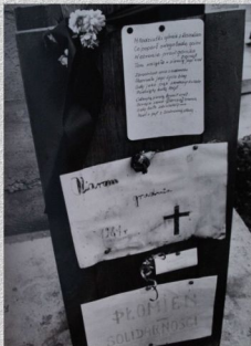
Ofiaram stanu wojennego.