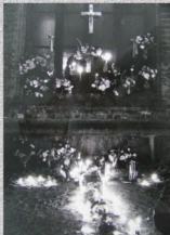
Katolicy w Kołczynie w sierpniu 1982 r.

Kościół w stanie wojennym stał się schronieniem dla solidarnościowego podziemia i miejscem, w którym toczyła się poważna część „bitwy” o świadomość społeczną. Wiele księży publicznie występowało w obronie represjonowanych. Msze za ojczyznę podtrzymywały opór społeczny. Ważną rolę w pierwszych dniach stanu wojennego odegrał Prymasowski Komitet Pomocy i jego diecezjalne odpowiedniki, organizując pomoc dla internowanych, więźniów i ich rodzin. Księża docierali z posługą duszpasterską do uwięzionych.