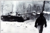
Czołg przed kopalnią „Wujek”. (w zbiorach ZR NSZZ „S” Pomorze Zachodnie)

14 grudnia 1981 r. fala strajków objęła cały kraj. Strajki okupacyjne ogłoszono w kilkuset największych zakładach pracy. Do ich spacyfikowania użyto jednostek ZOMO i wojska wyposażonego w pojazdy opancerzone i czołgi. Rozbito strajki w Stoczni Szczecińskiej, Hucie im. Lenina, kopalni „Manifest Lipcowy”, na wrocławskim Grabiszynie, w porcie gdańskim i Hucie Katowice. W wielu miejscowościach strajkom towarzyszyły demonstracje uliczne. Najbardziej gwałtowny przebieg miały one w Gdańsku. Szczególnie silny opór stawiali robotnicy Śląska, aż do 28 grudnia trwał strajk górników w kopalni „Piast”. 16 grudnia funkcjonariusze MO otworzyli ogień do broniących się górników w kopalni „Wujek”. Sześciu górników zginęło na miejscu, a trzech ciężko ranni zmarli w szpitalu.