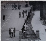
Koszalin - 31 sierpnia 1982 r.