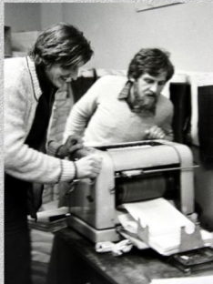
Drukownia „Judyty” (w zbiorach ZR NSZZ „S” Pomorze Zachodnie)

Do najbardziej widocznych przejawów oporu społecznego po 13 grudnia 1981 r. należały strajki i demonstracje uliczne. Codziennym widokiem stały się napisy na murach. Trudny okres pomogła też przetrzymać satyra. Przejawami oporu społecznego stały się znaczki „Solidarności” i opomiki noszone w widocznym miejscu, spacer w czasie „Dziennika Telewizyjnego” czy palenie świec w oknach w rocznicę wprowadzenia stanu wojennego.