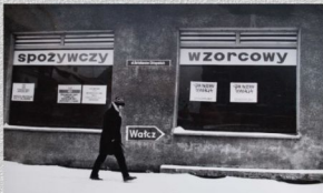
Plakaty z hasłami popierającymi stan wojenny (w zbiorach ZR NSZZ „S” Politeistę).

Główną troską dnia codziennego w stanie wojennym było zdobycie podstawowych produktów spożywczych i przemysłowych, mimo, że znaczna ich część była teoretycznie na kartki.