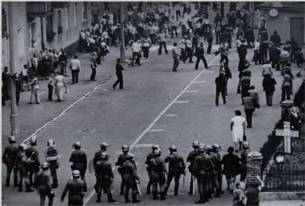
Horscain - 31 sierpnia 1962 r.