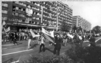
Szczecin - 1 maja 1982 (Wzbiornach ZR NSZZ „S” Pomorze Zachodnie)

Strajki okupacyjne rozbiło w grudniu 1981 r. Po miesiącu fala protestów znów ogarnęła kraj. Pierwsze strajki i manifestacje organizowano w związku z drastycznymi podwyżkami cen, a następnie nawiązywały do rocznic i dat symbolicznych, w tym „miesięcznic” wprowadzenia stanu wojennego. Znaczne rozmiary przybrały spontaniczne kontrmanifestacje pierwszomajowe, a 3 maja 1982 r. w wielu miastach doszło do gwałtownych demonstracji brutalnie tłumionych przez milicję.