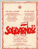
Plakat wzywający do przekazywania darów i funduszy na potrzeby „Solidarność” w Polsce. (w zbiorach prywatnych)