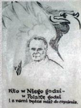
Plakat z okresu pielgrzymki papieża Jana Pawła II do Polski w 1983 r. (w zbiorach ZR NSZZ „S” Pomorzanie Zachodnie)

Kościół był miejscem spotkań twórców kultury: wystawiano w nich sztuki teatralne, organizowano wernisaże niezależnych plastyków i wykłady. W czerwcu 1983 r. z drugą pielgrzymką przybył papież Jan Paweł II. W Dolinie Chochołowskiej spotkał się z Lechem Wałęsą. Na całej trasie pielgrzymki witały papieża tłumy wiernych z transparentami „Solidarności”.