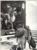
Pomoc niemiecka dla Polski