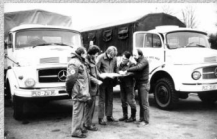
Pomoc niemiecka dla Polski dla Polski. (w zbiorach ZR NSZZ „S” Poznań)