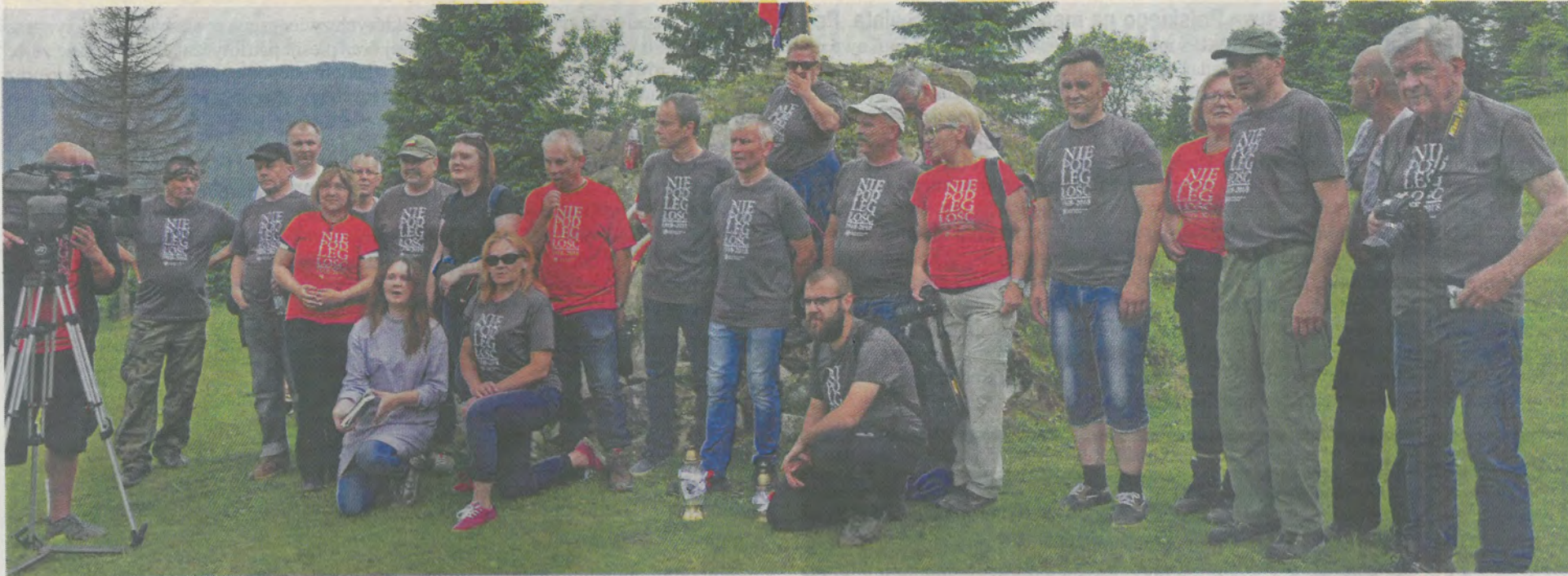
Uczestnicy wyjazdu studyjnego na Przełęcz Legionów.