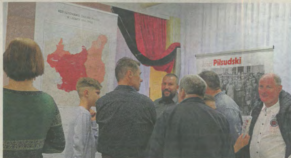
Odwiedzający wystawę w parafii polskiej na Mühlbergu we Frankfurcie nad Menem.

Szlakiem II Brygady Legionów - wyjazd studyjny zorganizowany 6 - 10 czerwca 2018 r. przez IPN Oddział w Rzeszowie i Stowarzyszenie Dziennikarzy Polskich Oddział w Rzeszowie, szlakiem Karpackiej Żelaznej Brygady Legionów przez Ukrainę i Rumunię. Pokłosiem tego wyjazdu będzie m.in. album, w którym znajdą się teksty historyków z IPN Oddziału w Rzeszowie oraz opracowania dziennikarzy opisujące współczesne realia terenów, na których działały Legiony, w tym również informacje dotyczące bazy turystycznej i regionalnych ciekawostek.