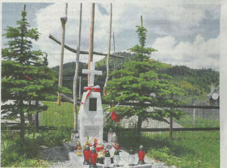
► Grób por. Stanisława Strzeleckiego i 4 legionistów