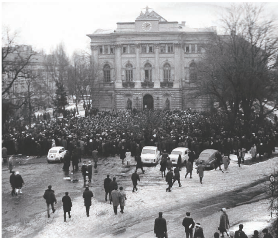
Ubecka fotografia wieceu na dziedzińcu głównym UW 8 marca 1968 r.

wzgl. służbowego ps. „Z”. W przeciwieństwie do relacji przygotowywanych z myślą o zwykłym czytelniku zamieszczone tu notatki były podporządkowane specyficznym celom. Informatorzy zwrócili szczególną uwagę na osoby występujące na wieceu – nie dla ich upamiętnienia, ale dla dostarczenia „materiału operacyjnego” Służbie Bezpieczeństwa. Co charakterystyczne, interwencji „aktywu robotniczego” i ZOMO oraz wystą-