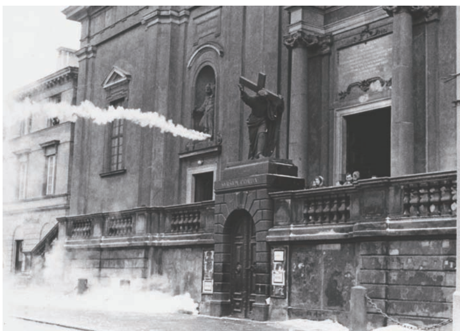
Brutalna interwencja milicji, marzec 1968 r.