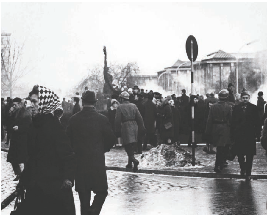
Walki z milicją w rejonie ronda gen. de Gaulle'a pod budynkiem KC PZPR, marzec 1968 r.

pieniu rektora UW w doniesieniach poświęcono najmniej miejsca – nie były to fakty najistotniejsze dla SB. Relacje te mają inny walor: zostały sporządzone niemal natychmiast po opisywanych w nich wydarzeniach. Z racji zbliżającej się 40. rocznicy wydarzeń marcowych w oczekiwaniu na zapewne licznie przygotowywane publikacje wspomnieniowe przedstawiamy relacje, których autorzy najpewniej nie chcieliby publikować.