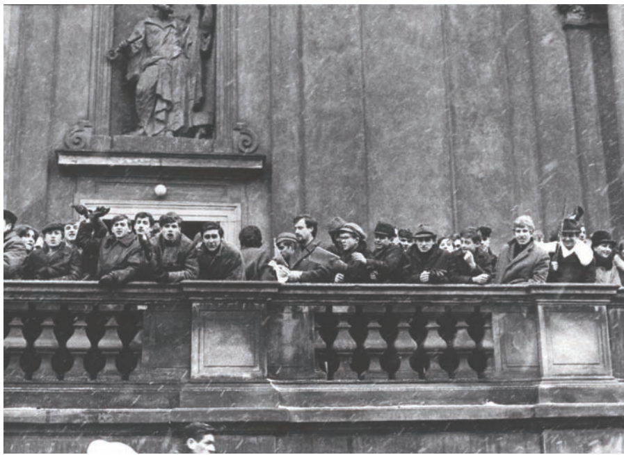
Protestujący studenci pod kościołem św. Krzyża na Krakowskim Przedmieściu, marzec 1968 r.

skim, który powiedział, że ci studenci, którzy przyszli na wiec w mundurach (Studium Wojskowego), będą sądzeni przez prokuraturę wojskową.